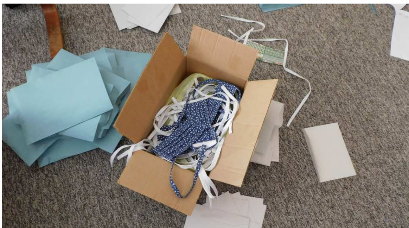
Příprava roušek pro nejohroženější skupinu šarovských spoluobčanů