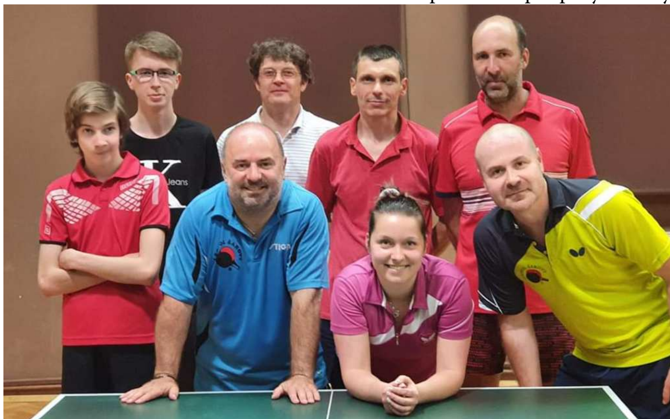
Torzo B-týmu před svým posledním zápasem v Holešově

Na závěr musíme poděkovat starostovi obce Šarovy a celému zastupitelstvu za podporu naší jednotě a našemu sportu. Bez podpory obce by