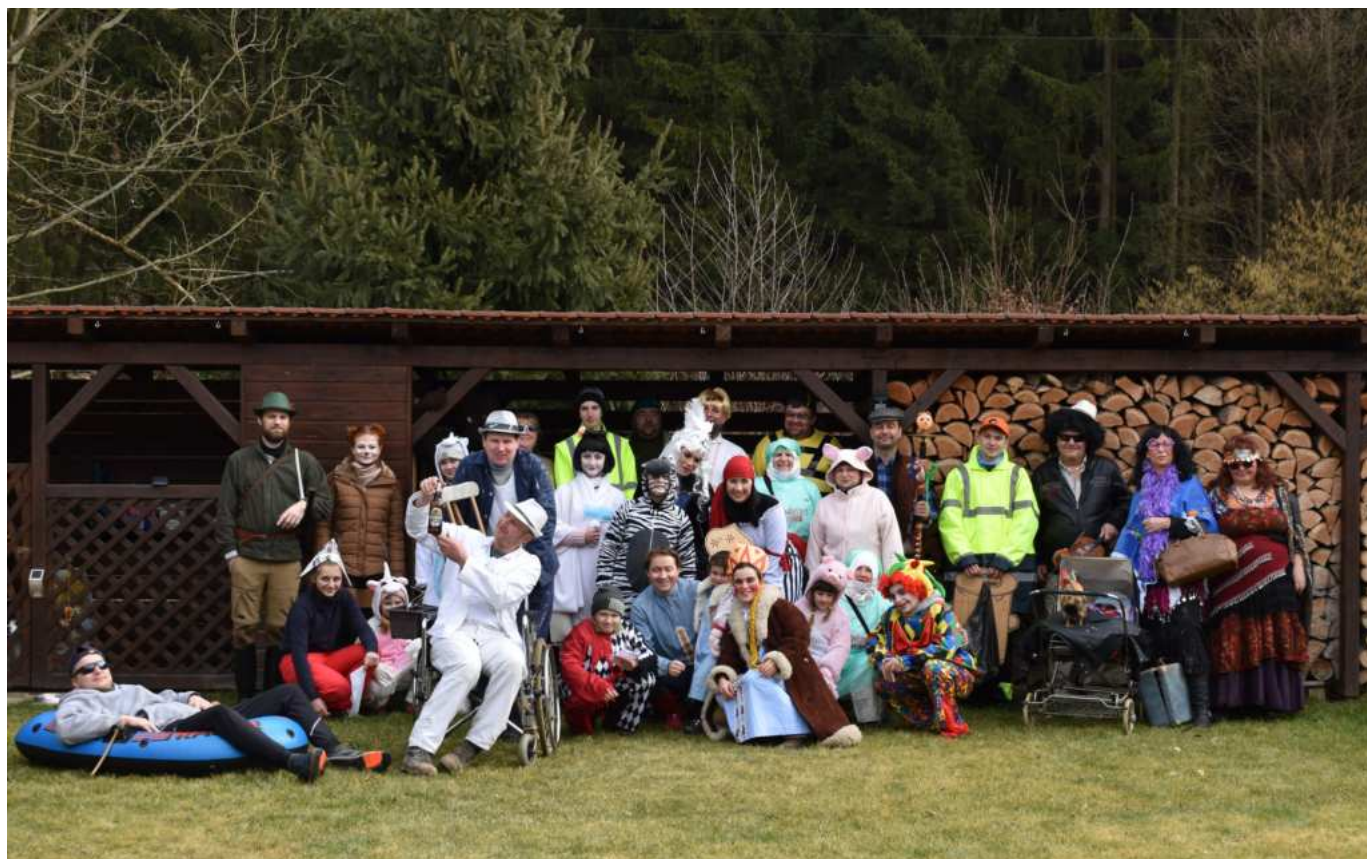
Maškar byla hromada

Ale ono šok. Ludí nakonec dorazilo dvakrát tolik. A to nečekali ani ti největší optimisti a tož bylo nutné eště přidat nějaký ten stůl a židlu, aby opozdilci