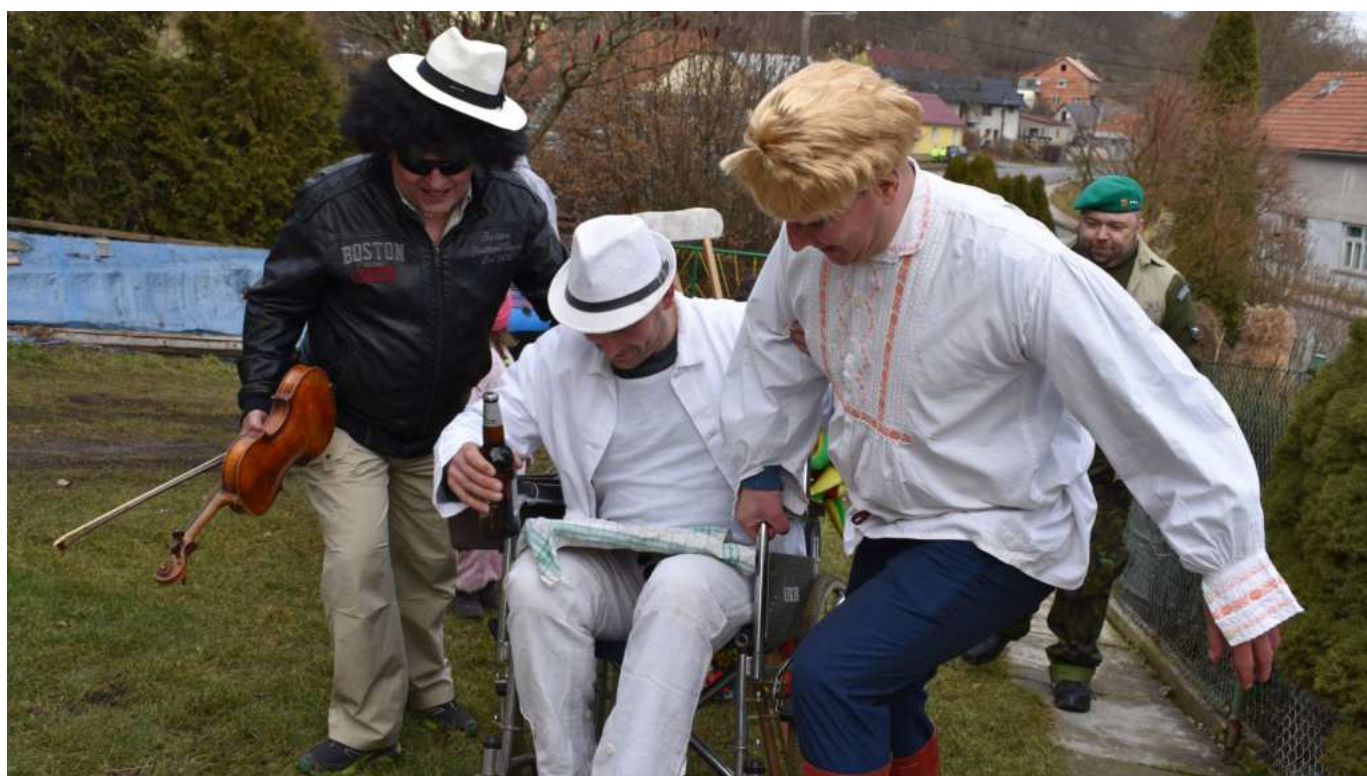
Neschopnost chůze byla u některých sůčást převleku

nemoseli lapět na zemi u radyjátorů. Tož byla to podařená zábava. Ludé tancovali, zpívali, jedli aj pili, velice nic nerozbili a podle blažených