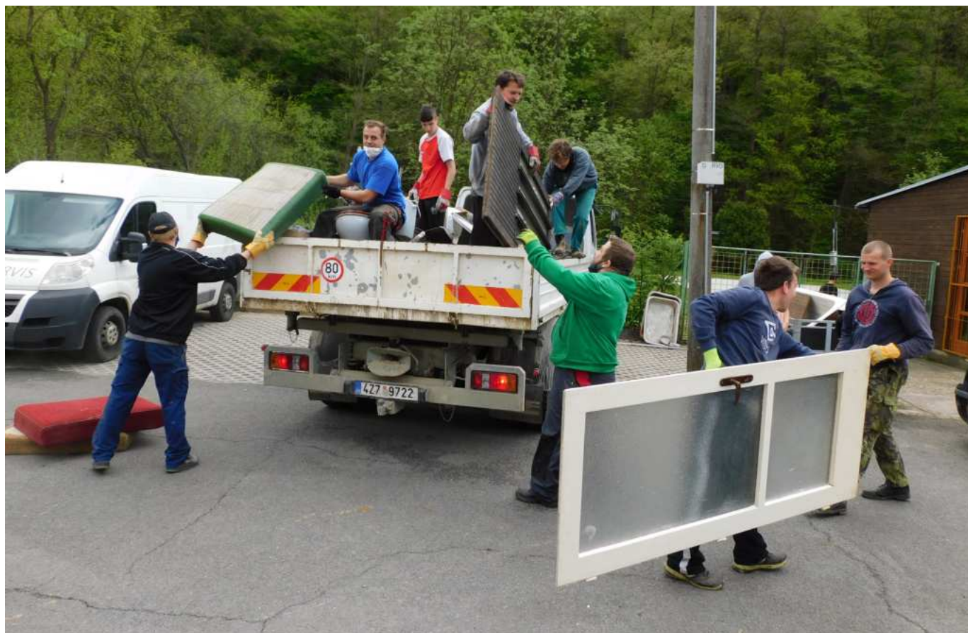
Hasiči při práci

občanům, kteří je o to požádali, protože nebylo v jejich silách rozměrné smetí do přistaveného kontejneru dopravit. Tradičně, jako na každých brigádách SDH byla účast členů na sběru vysoká, a to až tak, že překvapila i dodavatele