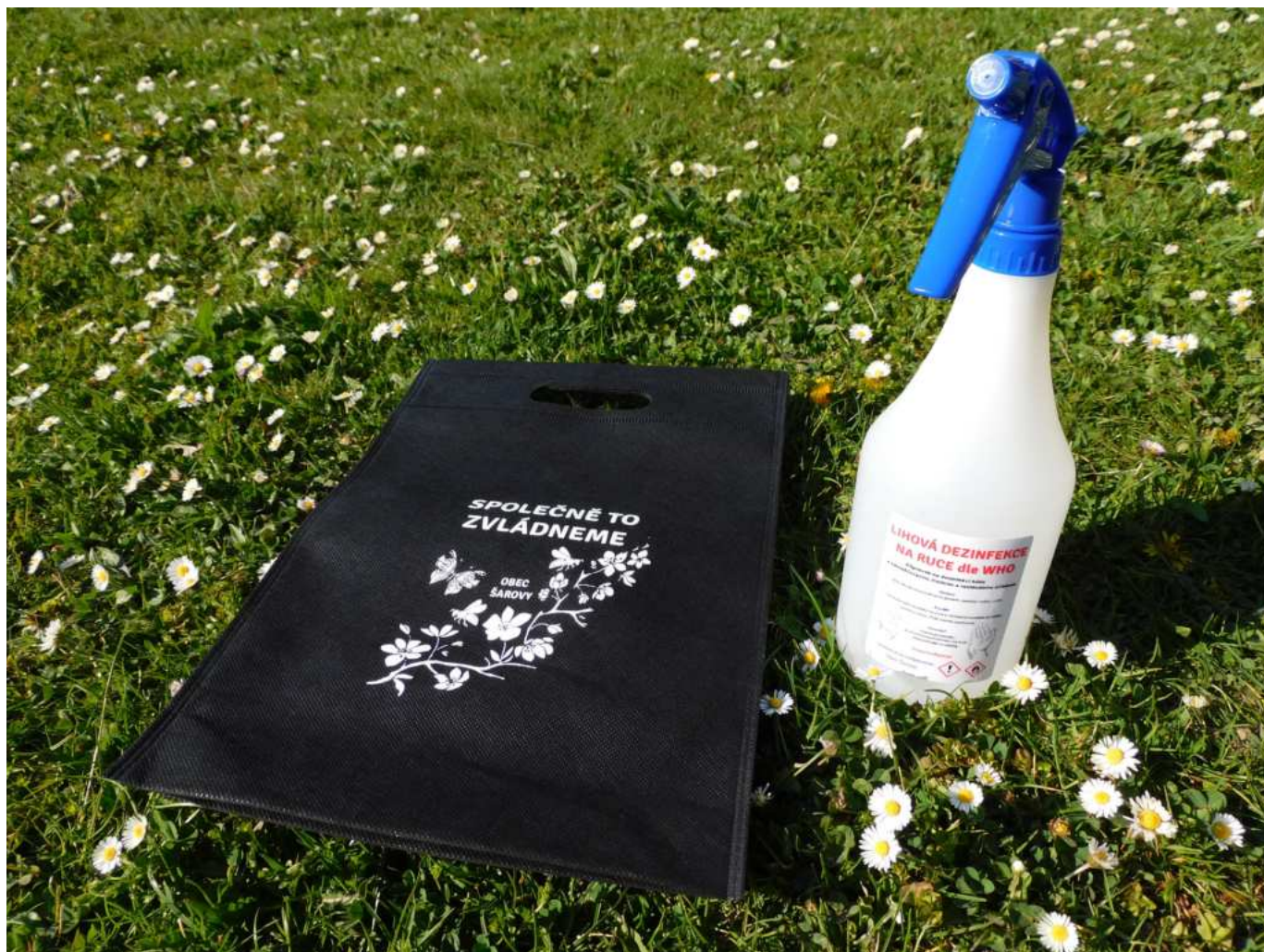
Dezinfekce pro šarovské občany

začalo používat to oblíbené a populární: „společně to zvládneme“. Ať už z úst lékařů, sester či celého zdravotního personálu, hasičů, policistů, vojáků, sportovců, umělců, herců, zpěváků, řidičů, sociálních pracovníků a v neposlední řadě i politiků všech stran a hnutí se neslo toto společné heslo.