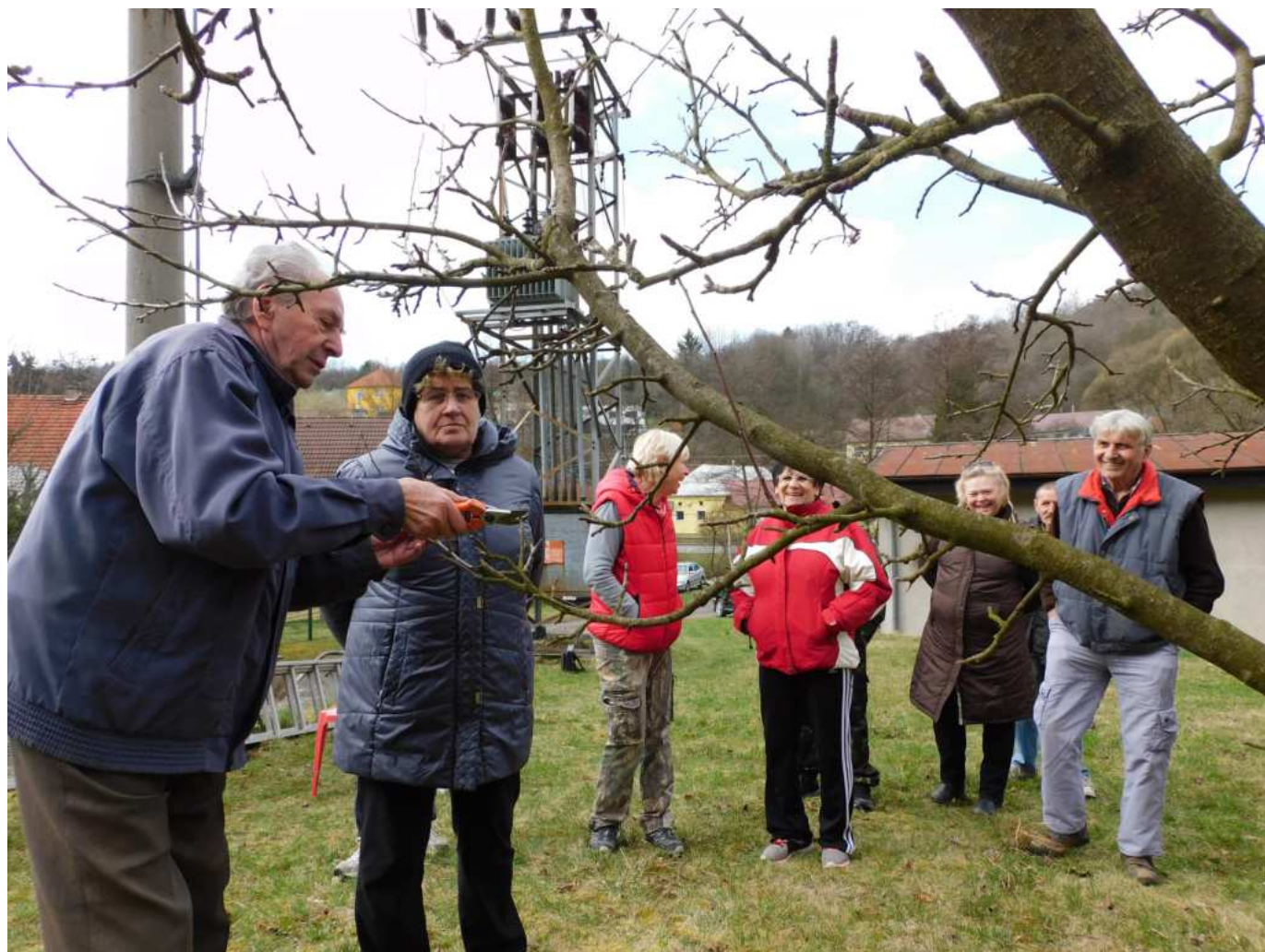
Šarovští pěstitelé byli velmi zvědaví

Během ukázkových řezů a stříhání různých ovocných stromů pan Němeček odpovídal na dotazy účastníků, také