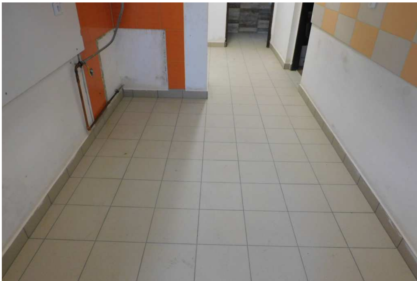
Během korona přestávky se podařilo zrekonstruovat sklad v šarovské hospodě