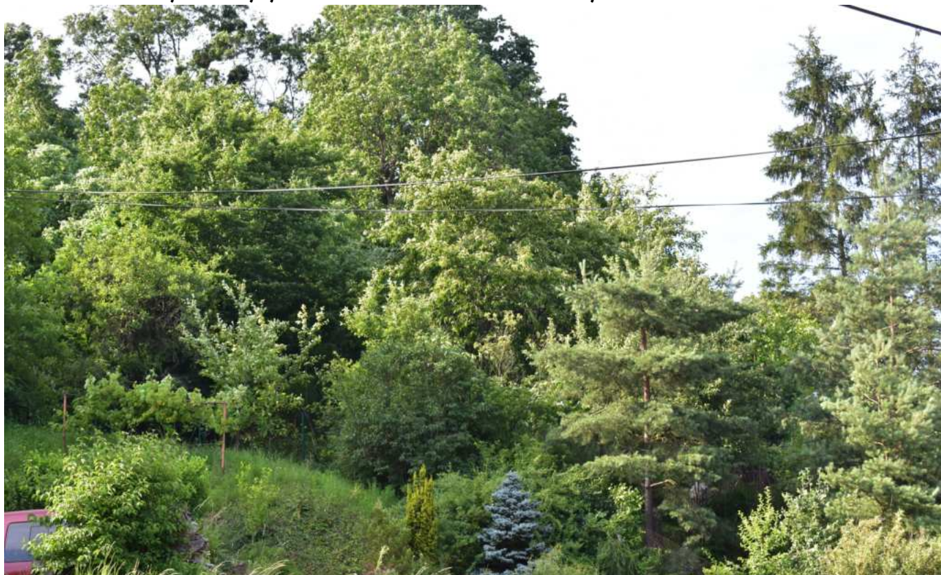
Popelkova skala dnes připomíná spíše les

V obci se nacházely ještě dvě menší skaly. Přešlo se přes obecní louku, dnešní výletišť, přskočil potok a byli jsme ve skale. Chodníčkem nahoru pak do lesa. Nahoře bylo oblíbené místo různých her děcek. A také na pozorování tanečních zábav na výletišti. Mezi dospělé lidi děcka nemohla, ale nahoře na skale to zakázané nebylo.