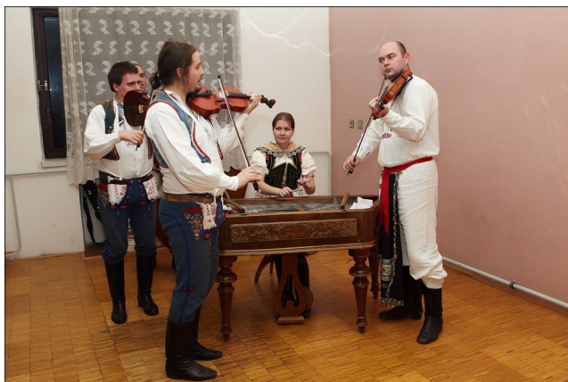
Cimbálová muzika Vonica.

počtu přihlášených vzorků (37 trnkových, 7 ostatního ovoce). V drtivé většině šlo o loňské vzorky. Zajímavostí byla trnková slivovice víc jak 30 let stará (nález ve stodole), ta však nezaobodovala. O umístění vzorků rozhodovala 21 členná porota sestavená z majitelů vzorků. Větší polovinu tvořili přespolní degustátoři.