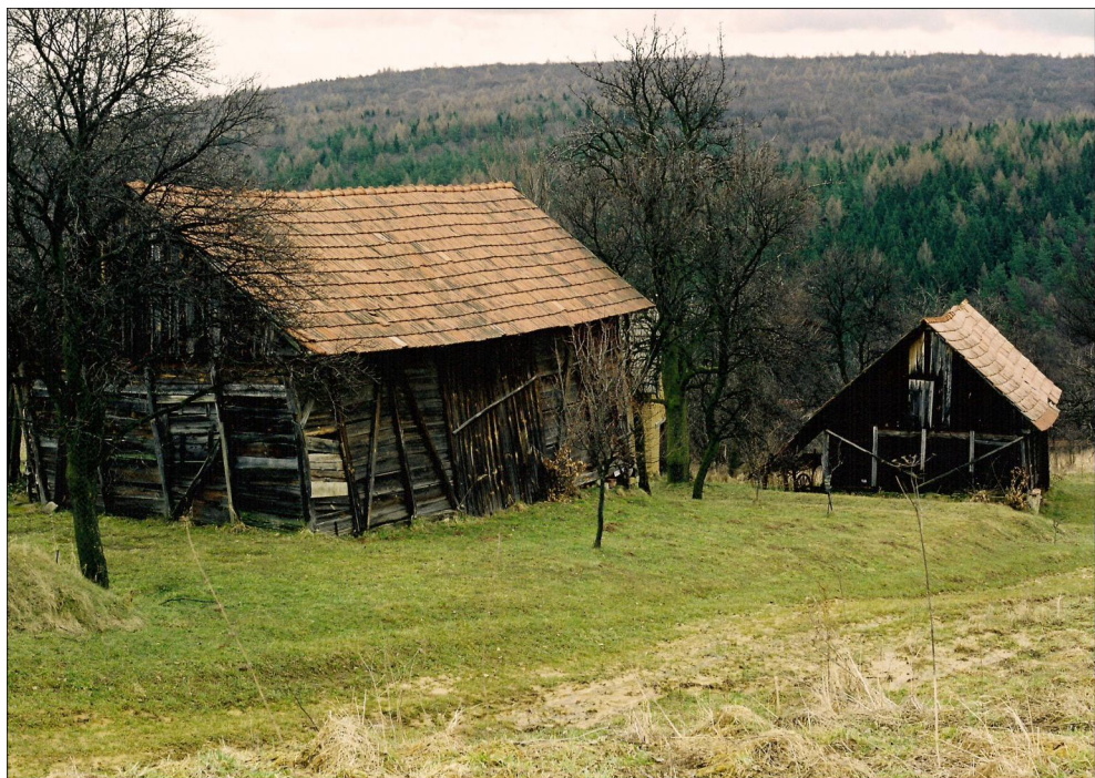
Stodoly Ondrášova a Ondrašíkova 39.