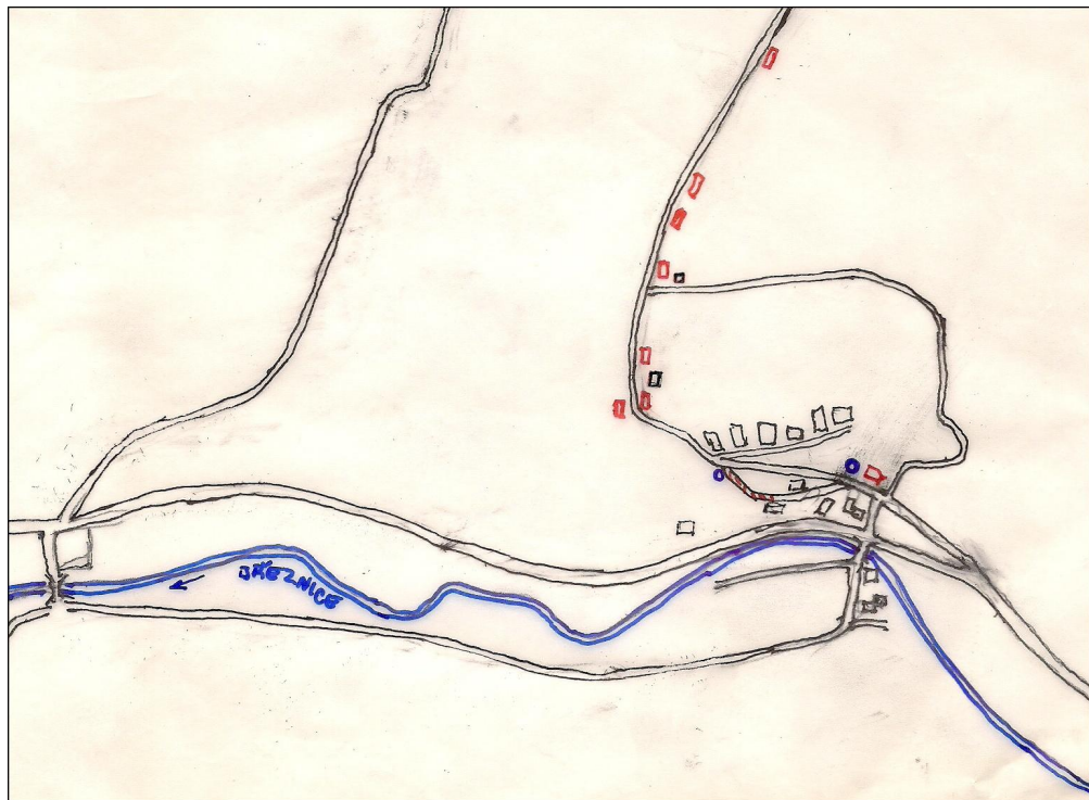
Schéma rozmístění studní a stodol

Druhá studna byla pod cestou v blízkosti žlebu u domu č. 46. Byla hluboká přes dvacet metrů, vyzděná kameny. Kolem bylo dřevěné bednění se stříškou. Pod ní byl rumpál na spouštění dřevěného okovu do studny. Okov byl zaháknut na řetězu, točením kliky na boku rumpálu se spouštěl dolů, nabral vodu a zase putoval nahoru. Voda se přelávala do dřevěných putének tak dlouho, až bylo dostatek vody pro dobytek a domácnost. Studna by jistě dnes vzbuzovala velkou pozornost kolemjdoucích. Během času však došlo k pohybu okolní půdy, kamenná vyzdívka se posouvala natolik, že bylo nebezpečné jen kolem studny projít. Tak se po částech zasypávala.