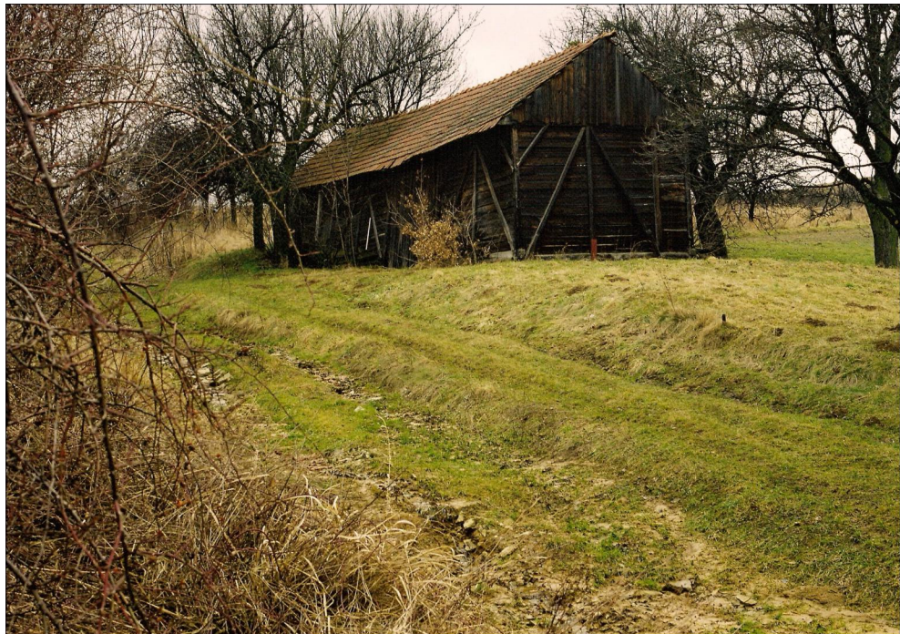
Ambrůzova stodola.