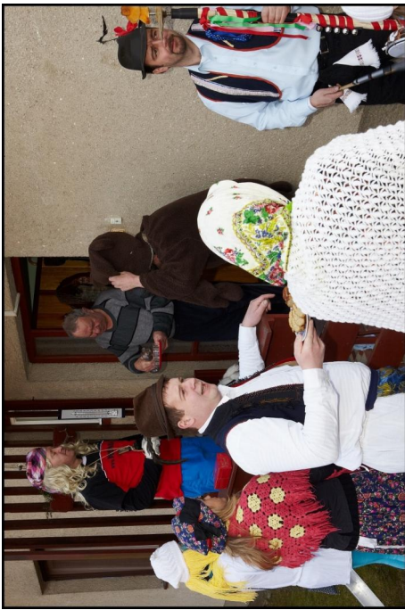
FAŠANK 2011