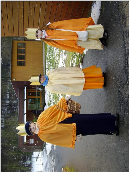
TŘÍKRÁLOVÁ SBÍRKA 2011