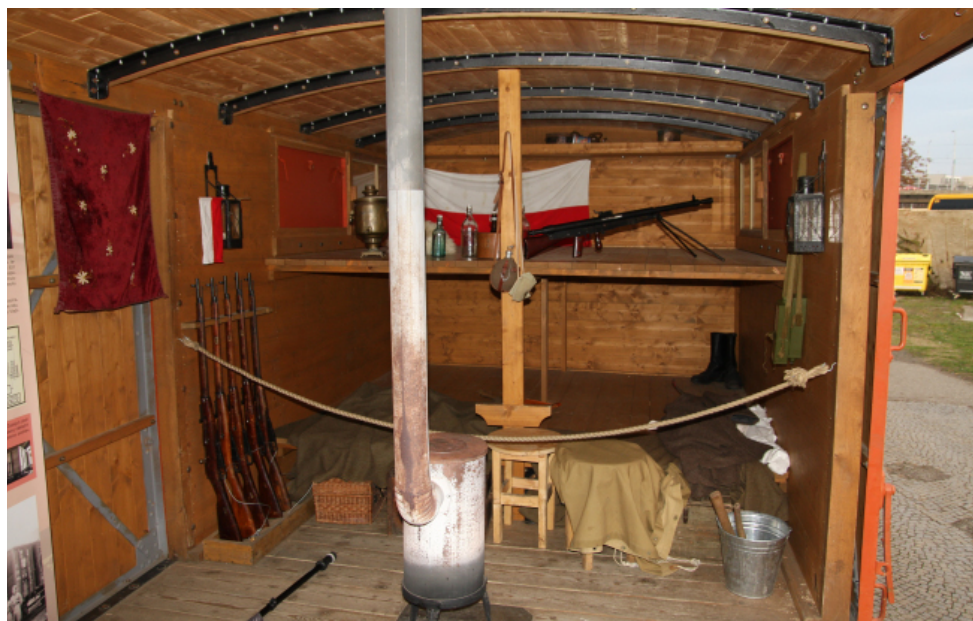
Legiovlak ve Zlíně.