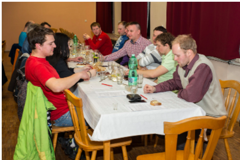
Koš slivovice.