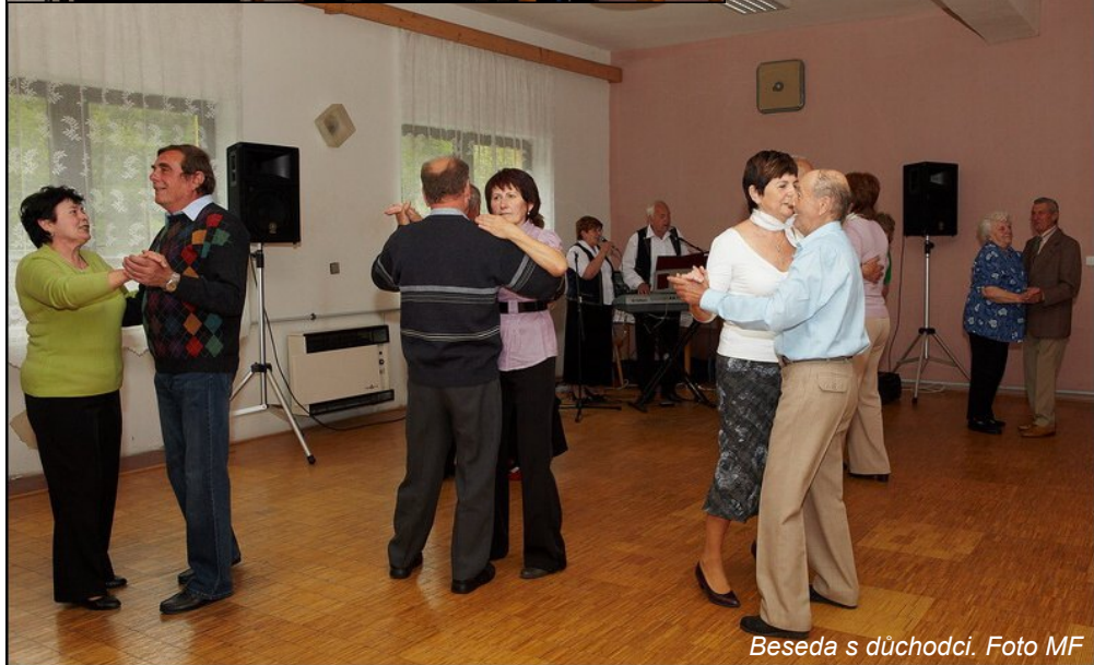
Beseda s důchodci.

ností a plány občanského sdružení Šarovské hejtmanství a odpověděl na dotazy.