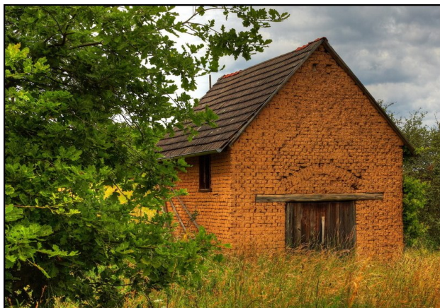
Zděný přístavek.

Pokračujeme ve statích Šarovské cesty a chodníčky: