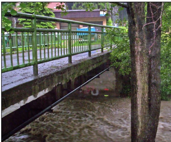
Povodňové značky.

Dne 25. května byl na horním konci obce opět instalován radar měřící rychlost příjezdějících vozidel. Tentokrát je majetkem obce, takže už nehrozí jeho odebrání. Vzhledem k jeho pořizovací ceně je více než dobrá nadpoloviční dotace nadřízeného orgánu. Věříme, že radar přispěje ke zvýšení bezpečnosti v obci.