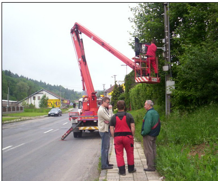
Montáž radaru.