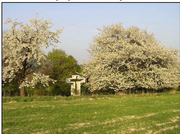
Kvetoucí třešně.

Kolem cesty vysazovali hospodáři ovocné stromy, většinou třešně a švestky.