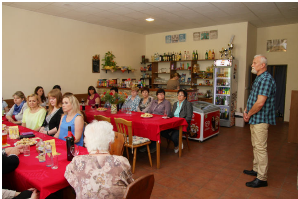
Den matek se oproti letům minulým nesl v příjemné komorní atmosféře