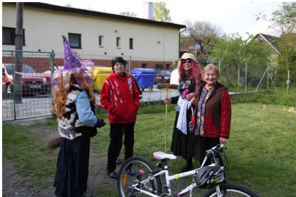
Letošního šarovského sletu čarodějnic se zúčastnily....

Po skončení soutěží přišel jako vždy vrchol večera, tradiční podpálení vatry i se slaměnou čarodějnici, symbolem zimy a zlé moci. Tím jsme úspěšně vyhnali zlé duchy z naší dědinky. Každý si pak mohl