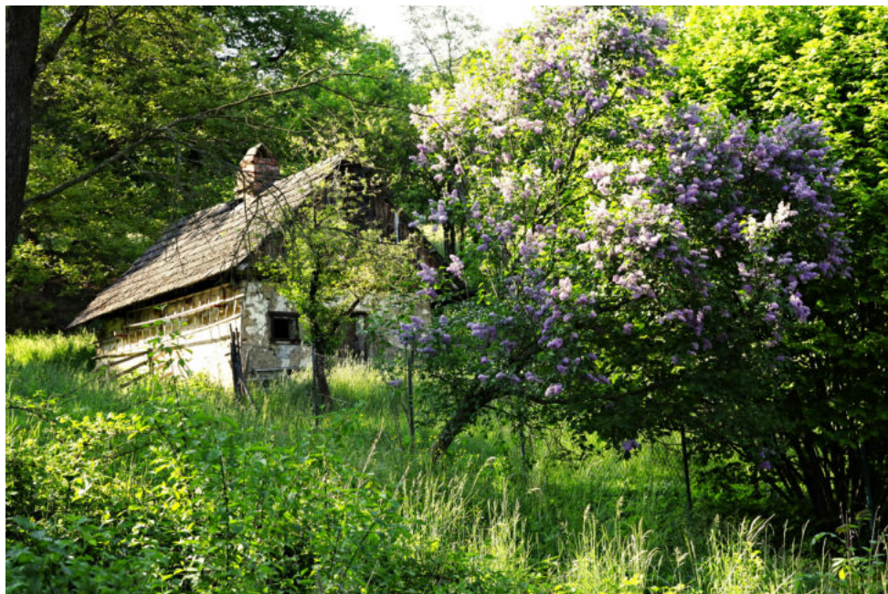
Jaro na Šarovech má své kouzlo stejně jako ostatní roční období