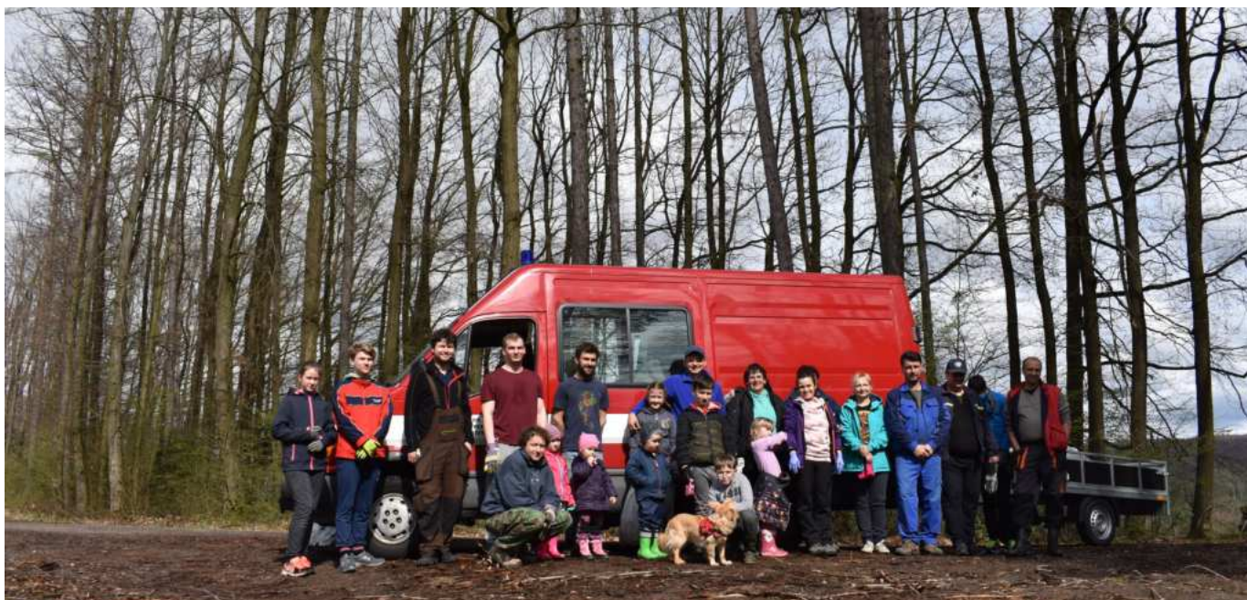
Úklidová četa ze Šarov

z černé skládky nad zastávkou Lpač. Znovu jsme spojili síly s dobrovolníky ze Lhoty. Bylo nás dohromady asi 40, z toho polovina byly děti. A víte co? Příští rok půjdeme klidně zase. Stojí to