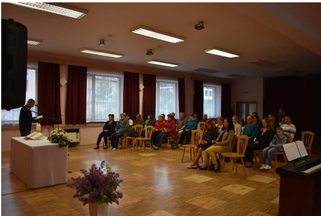
Šarovští věřící zaplnili celý sál