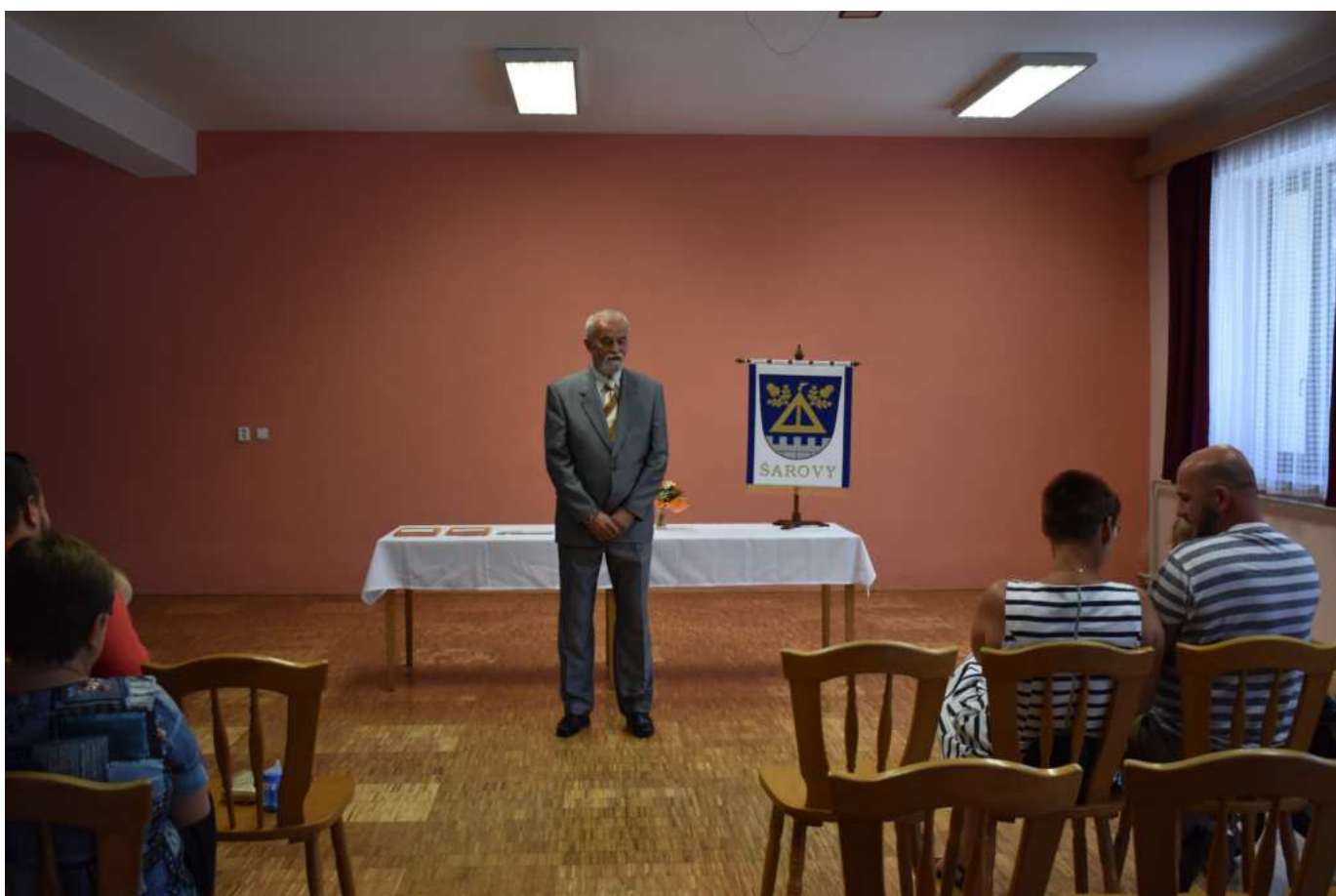
Pan starosta vt nov obanky