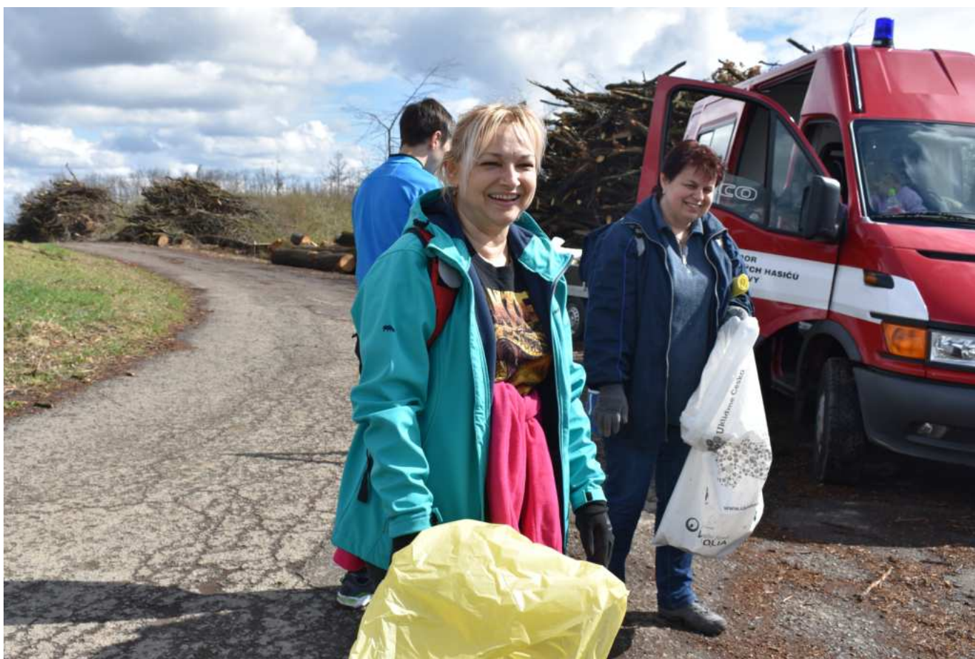
Na nepořádek s úsměvem