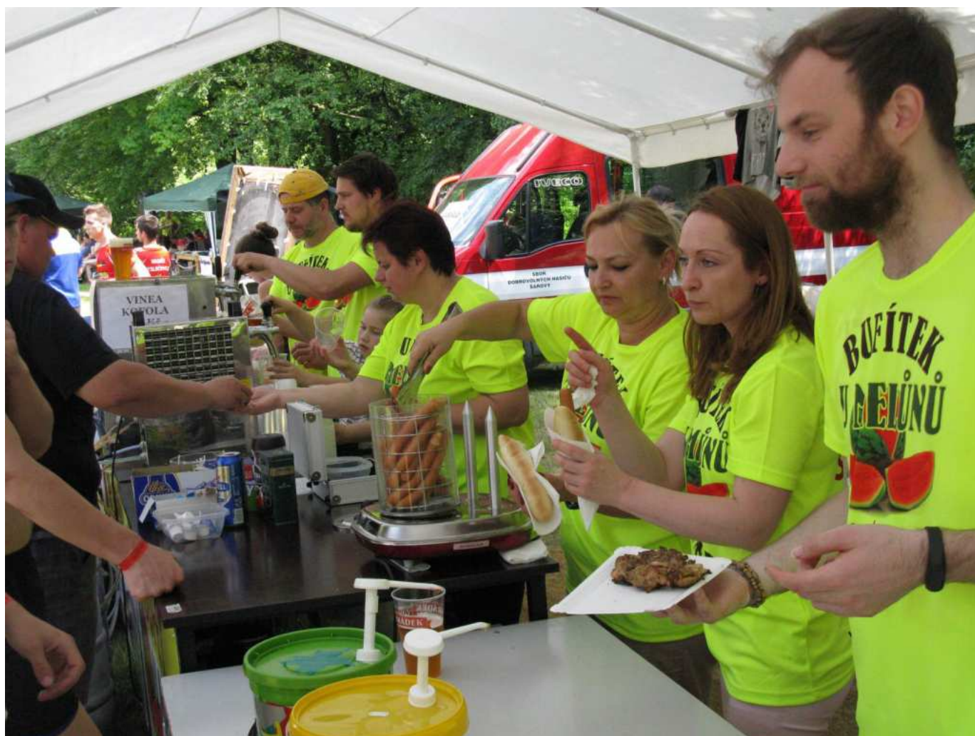
V bufetu U Melúnů

Novinkou byla kategorie mužů nad 35 let, kde snad pro větší motivaci, byly pro závodníky přichystány i tekuté