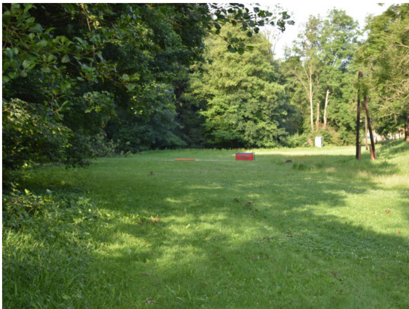
Hasičské cvičiště - šarovské?

se také věnujeme požárnímu sportu a to na louce u „Rája“. Tato louka je nejvhodnějším místem v katastru obce Šarovy a dá se říci, že zřejmě jediným místem, kde lze šarovský požární sport provozovat. Je mimo