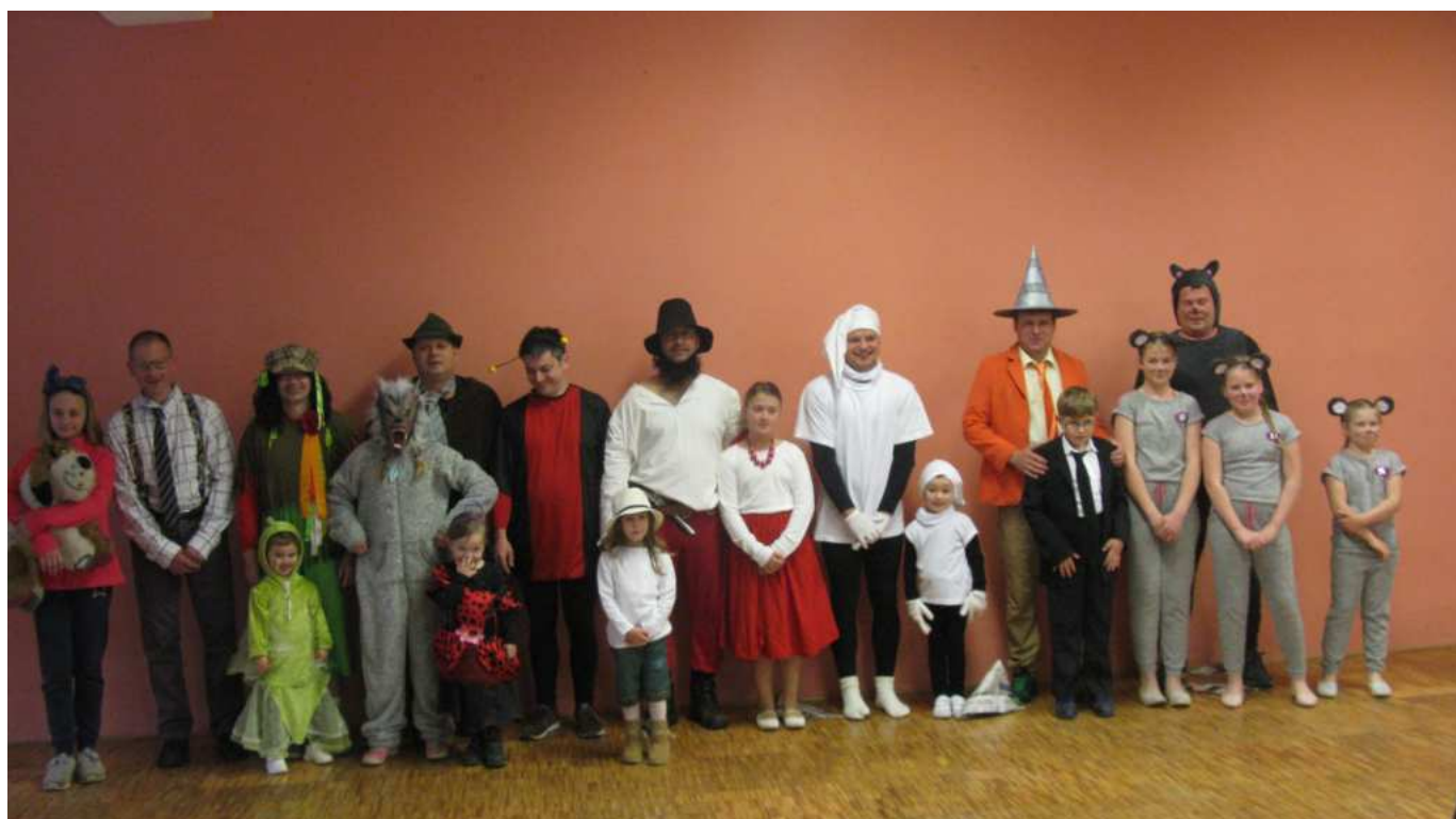
A se svými tatínky zatancovaly