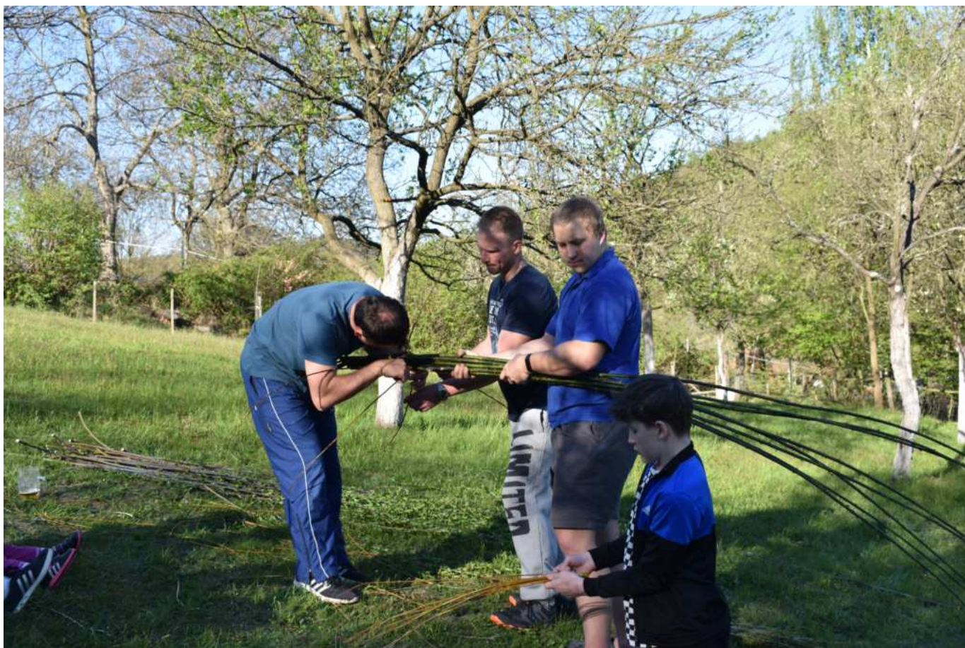
I letos se pletly tatary...