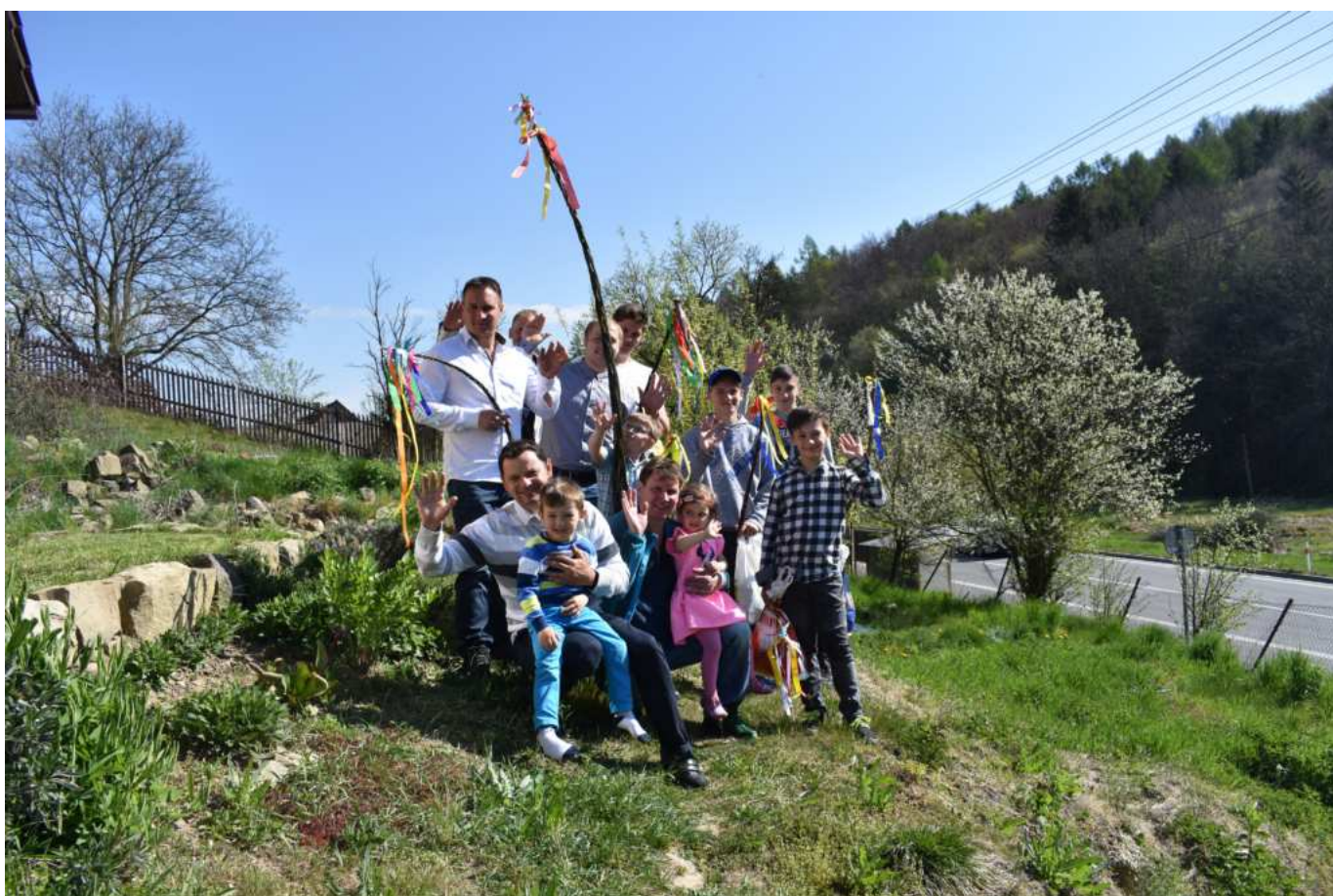
... aby se mohlo na obchůzku.