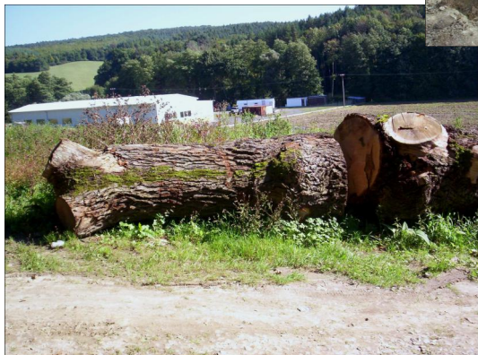
Hykův dub.