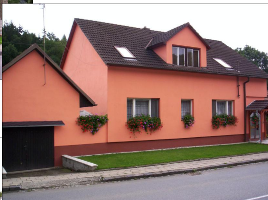
Jarmila Šustková.