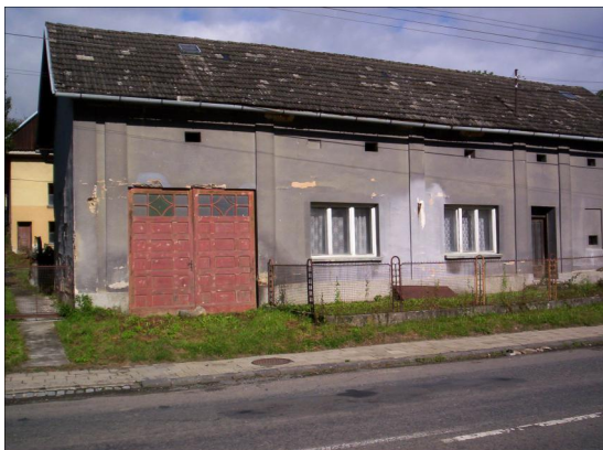
Dům č.18.

Na druhé straně je však třeba uvést, že velkou ozdobou nejsou dva domy stojící blízko sebe.