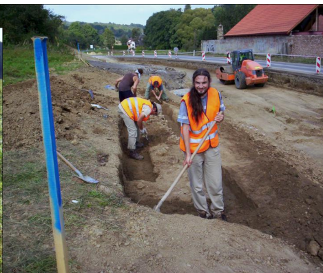
Odkrývání základů Zavadilky.

Záchranný výzkum objevil nejen původní základy Zavadilky, ale také množství kousků keramiky z období od 15 – 18. století. Mimo to i několik železných předmětů, pravděpodobně i jednoho nože, a ucho od sklenice. Kousek dál byly nalezeny zbytky dalších objektů, zřejmě starších o asi tři století. Osobně si myslím, že by to mohly být základy krajních domů původní obce Šarov.