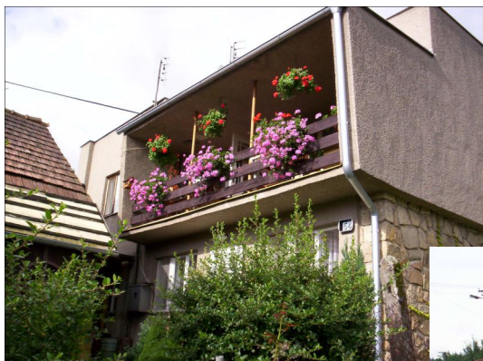
Věra Blizňáková.