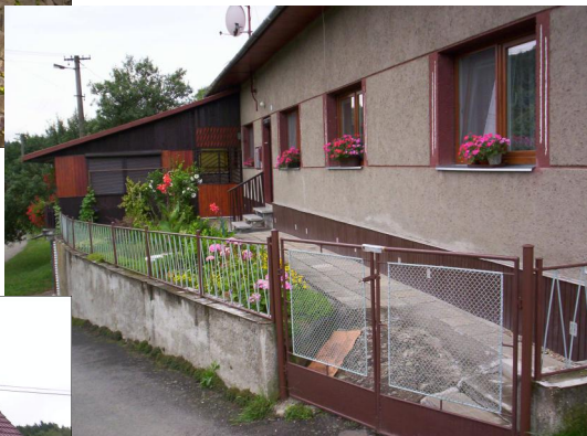
Ludmila Jurčová.