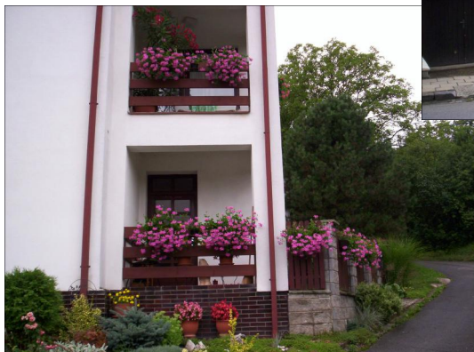
Jarmila Ulčíková.