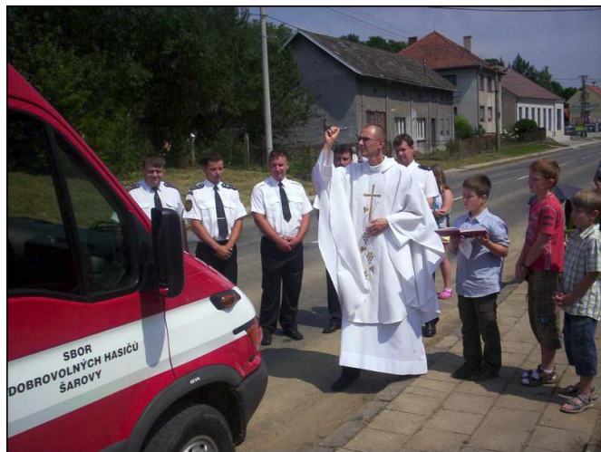
Vysvěcení zásahového vozidla.

Prázdninový den vyšel podle nejkrásnějších představ – modré nebe, zářící slunce a teplota 32 °C. Občané Šarov mohli tento den užívat od rána. V 10. hodin