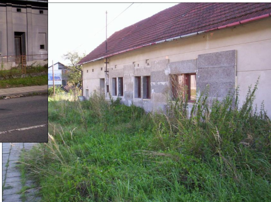
Dům č.63.

Jejich majitelé by se měli zamyslet, co s nimi udělat, aby vzhled obce nepoškozovaly.