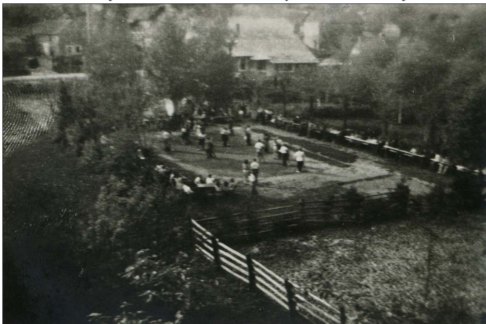
Takto vypadalo dnešní výletišťe na počátku minulého století.

Hasiči si na části louky upravili cvičišťe, výletišťe ohraničené růžemi, keři a stromy. Na hasičské veřejné cvičení se