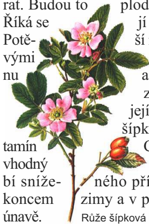
Růže šípková Rosa canina

I v měsíci říjnu a listopadu máme možnost ještě něco pro své zdraví nasbírat. Budou to plody růže šípkové. Říká se jí také planá růže. Potěví nás svými různými květy v květnu a červnu, na podzim zdaleka září její červené plody - šípky, bohaté na vitamín C. Čaj ze šípku je vhodný zejména v období snížené přísunu vitamínu koncem zimy a v předjaří při jarní únavě.