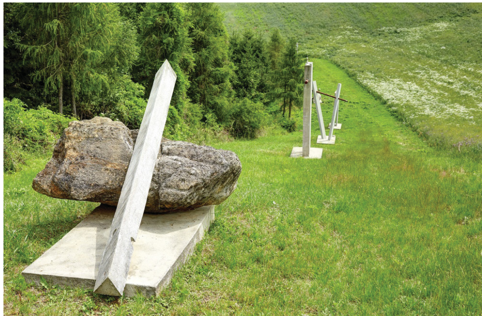
Křížová cesta v Bukovanech.