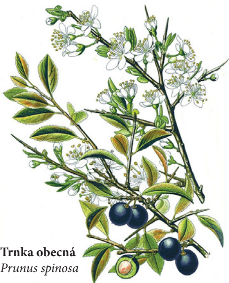
Trnka obecná Prunus spinosa

Trnka obecná ( Prunus spinosa ) - velký listnatý keř. Trnky dozrávají na podzim, mají sametově modrou barvu a velmi trpkou chuť. Trnky se používají zejména pro přípravu hřejivých nápojů. Když