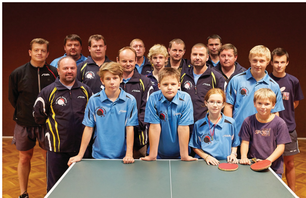
Účastníci soustředění v Hluku.

Obec nám poskytuje zázemí v sále pohostinství včetně energií a v letošním roce poskytla finanční příspěvek ve výši 10 tis. Kč. Co se týká zázemí, kompenzujeme tyto náklady zajištěním kompletního servisu sálu a brigádami na výletišti a v okolí budovy obecního úřadu. Předpokládám, že každý občan, který občas sál navštěvuje, zanamenal nové osvětlení, novou kuchyňku, že je vymalováno. Finanční příspěvek je určen na částečné pokrytí trenéra pro děti (7 tis. Kč) a nákladů na hudební skupinu při pořádání