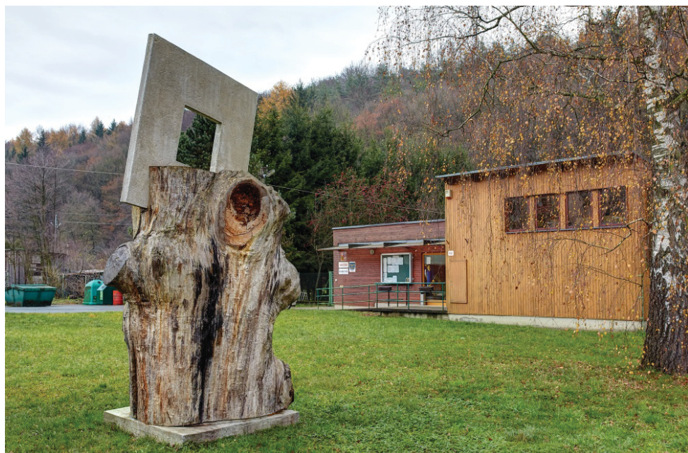
Hykúv dub „Memento.“