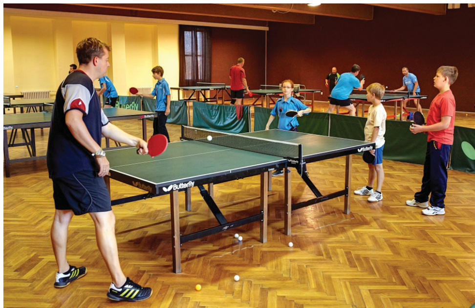
Soustředění v Hluku.