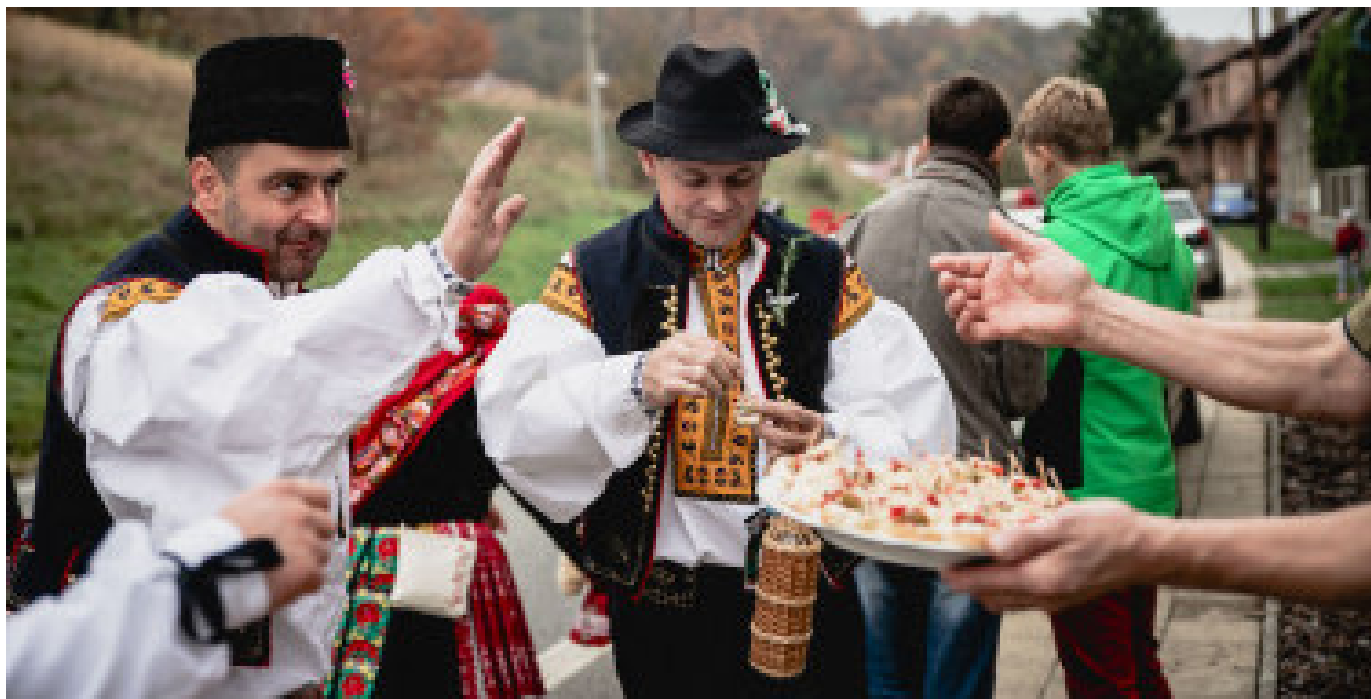
Momentka z loňských šarovských hodů

Dnes můžete narazit na dědiny, které slaví hody již v létě (červenec, srpen), ale i na obce, které hodují až těsně před adventem