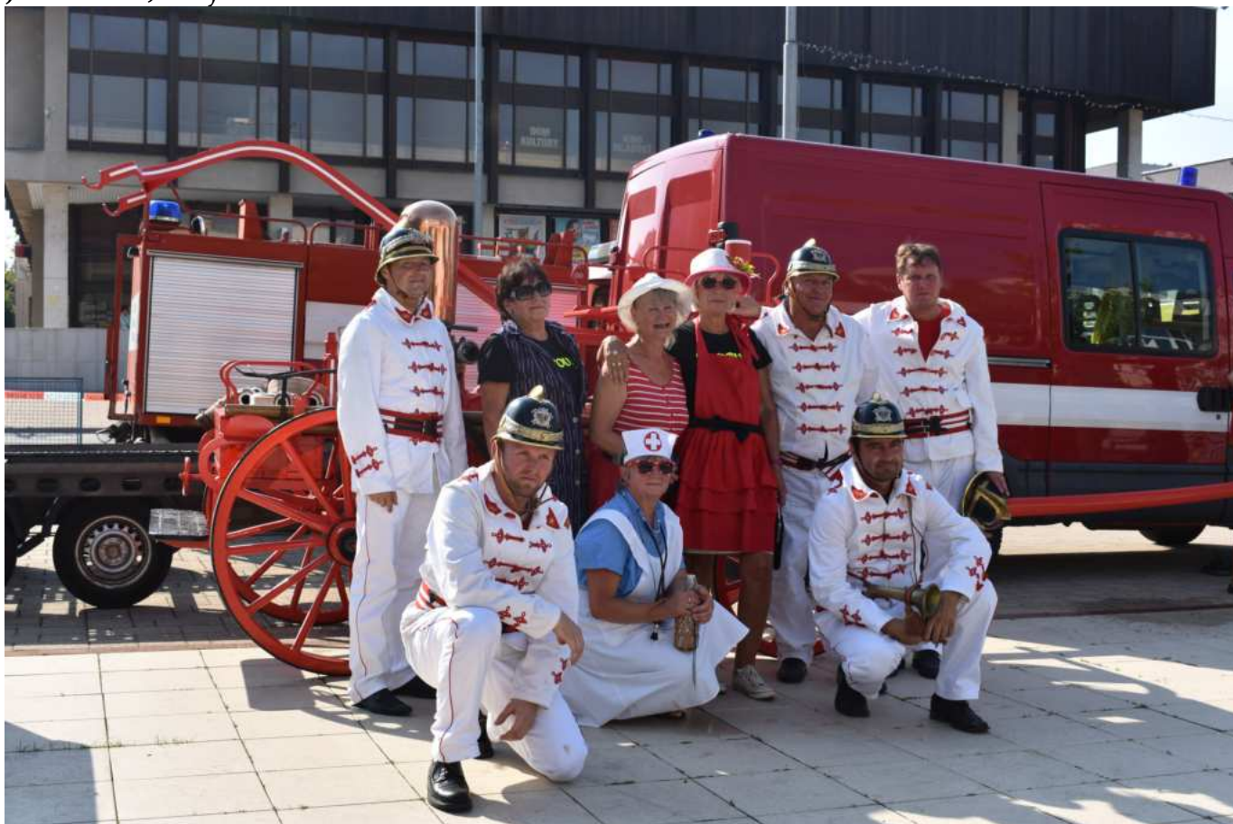
Zasahující členové i členky