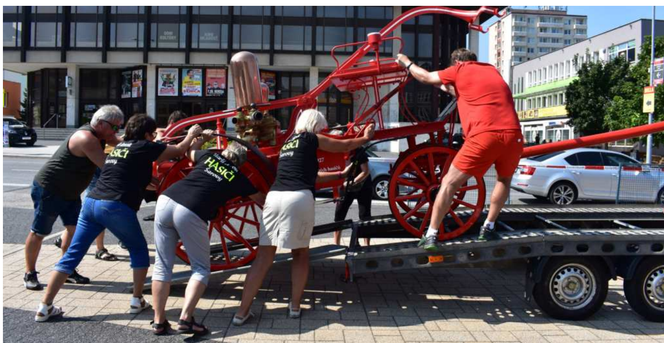
Naložit, vyložit, naložit....

Asi se ptáte, jak na šarovskou stříkačku