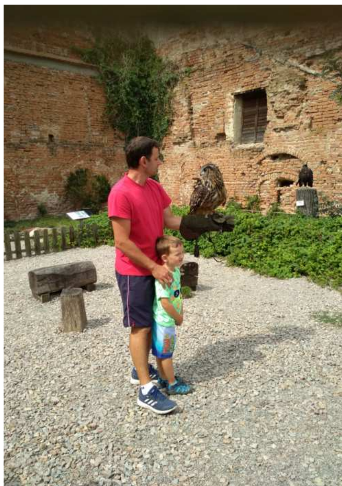
Starosta SDH šel příkladem