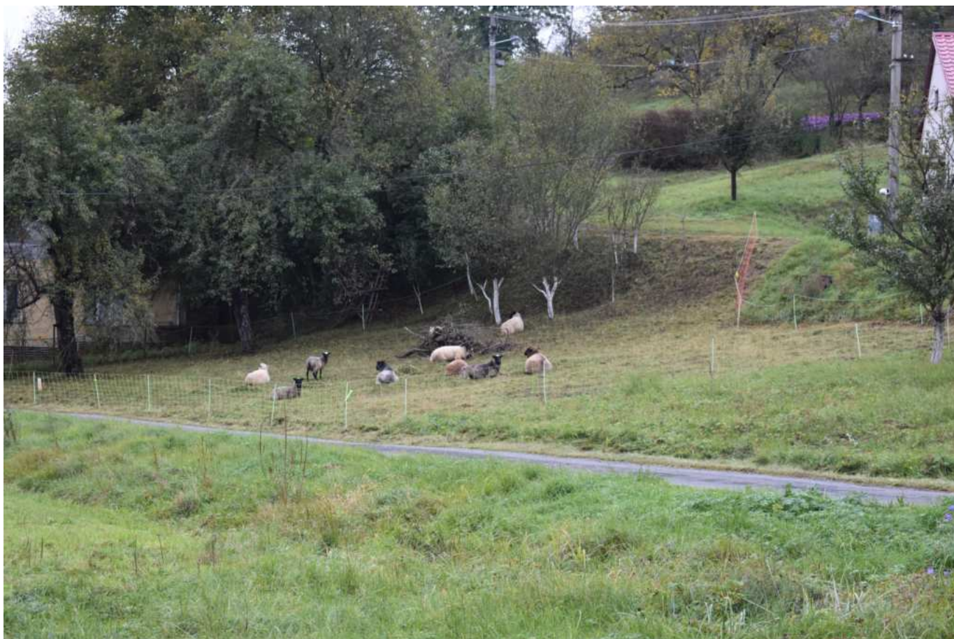
Nedělní pohoda na horním konci