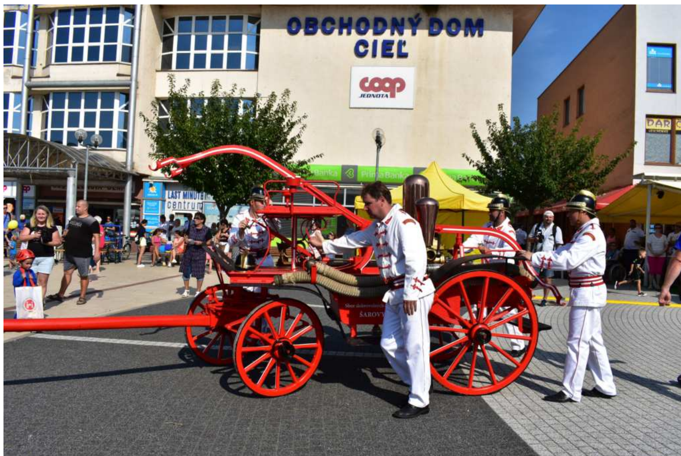
Příprava na zásah.

Pravda, ukázka nebyla příliš seriózní, ale lidé na náměstí se bavili a přitom se