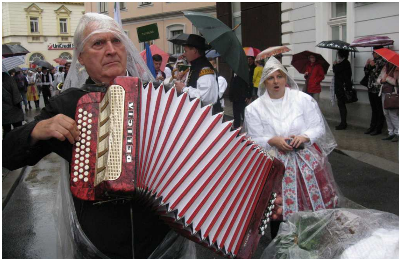
Nová šarovská muzika

spolku, bohužel neúspěšně. No a pak zkusily štěstí děvčice, které se s tím nepáraly. To, jak se po pár deci vína dostaly do Březolup, nebudeme raději