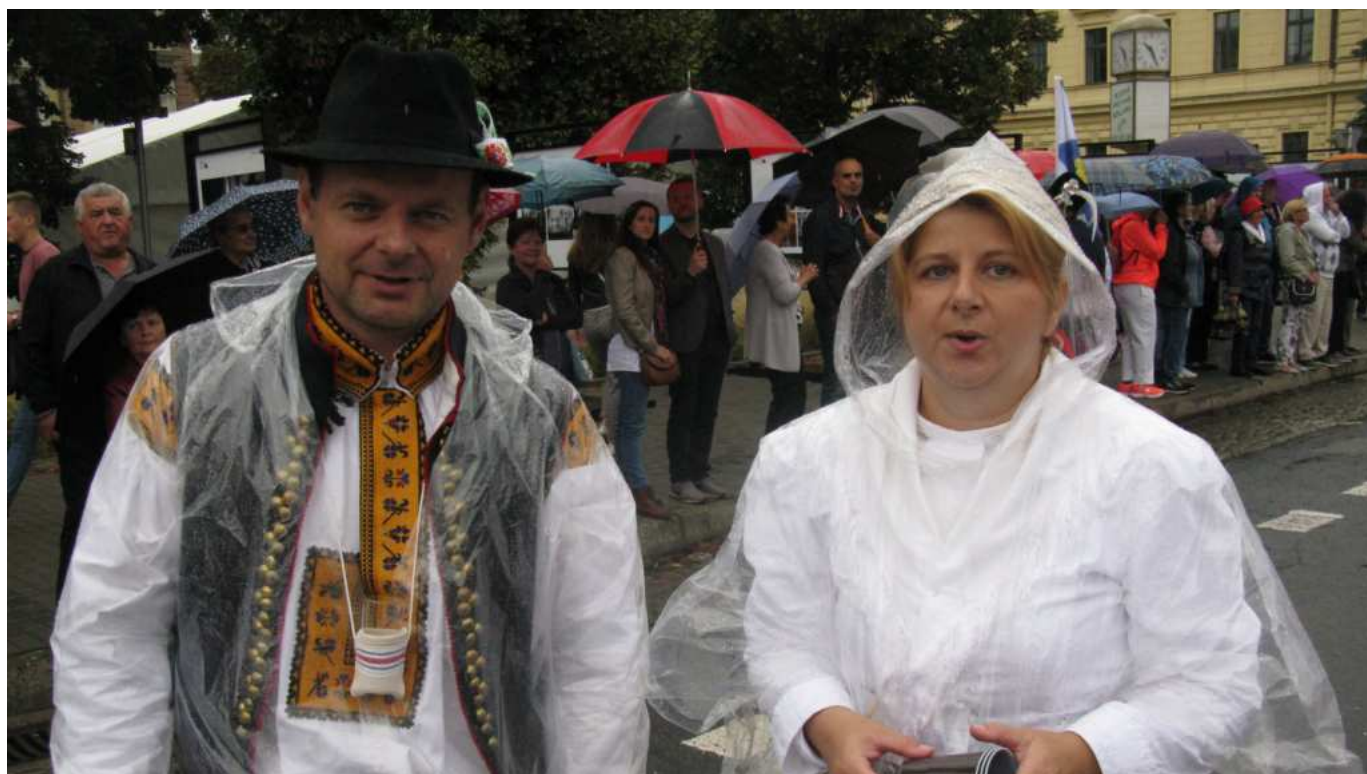
Kvalitní pěvecké výkony nechyběly

rozebírat, neboť si tento čtvrtletník přečtou i zodpovědní řidiči. Tři členky chasy překvapily užaslého pana Šišáka (od toho momentu „strýca“)