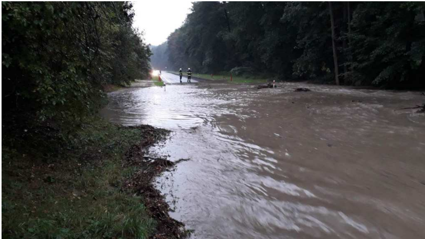
Potok Březnice se vylil z břehů u Rája