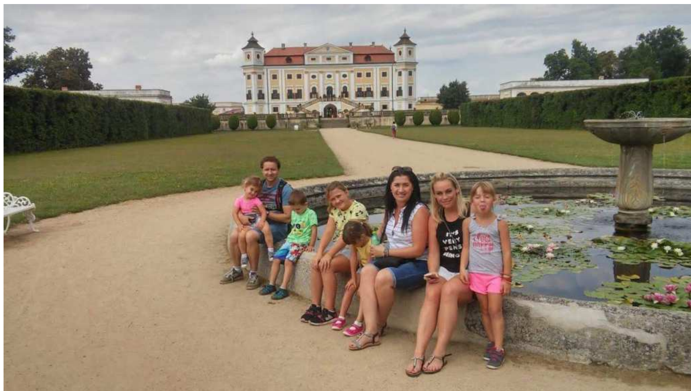
V Milotickém zámeckém parku.