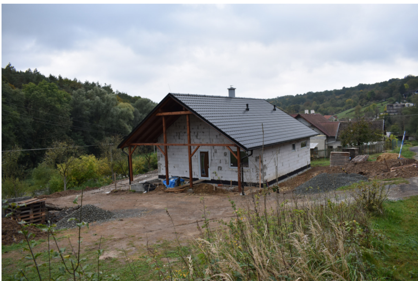
Na horním konci budeme mít brzo nové sousedy