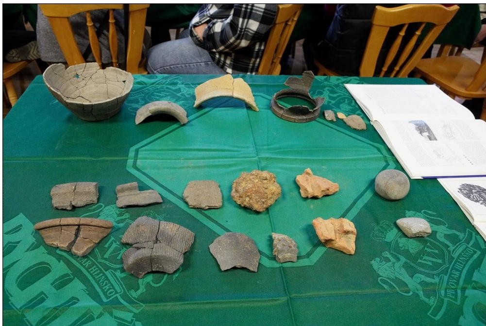
Ukázky vykopávek.

V následující diskuzi padly i další náměty: