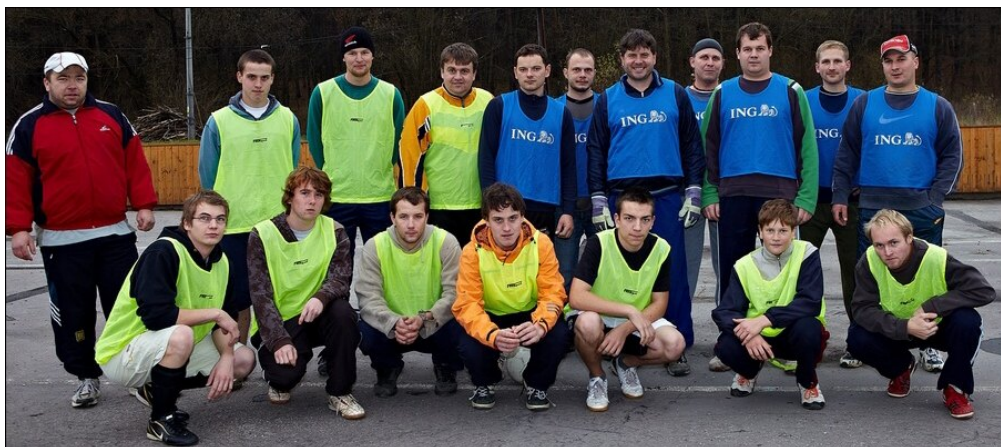
Hodový fotbal.