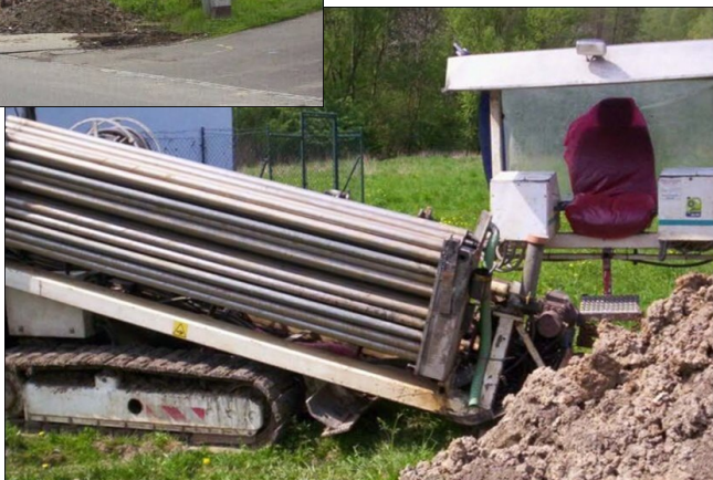
Stavba vodovodu.

10. října svolali kandidáti do obecních voleb pod jménem Nezávislí předvolební shromáždění, na němž přítomné občany seznámili se svým volebním