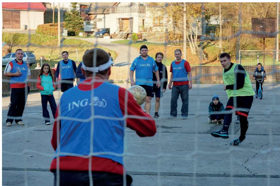
Hodový fotbal.