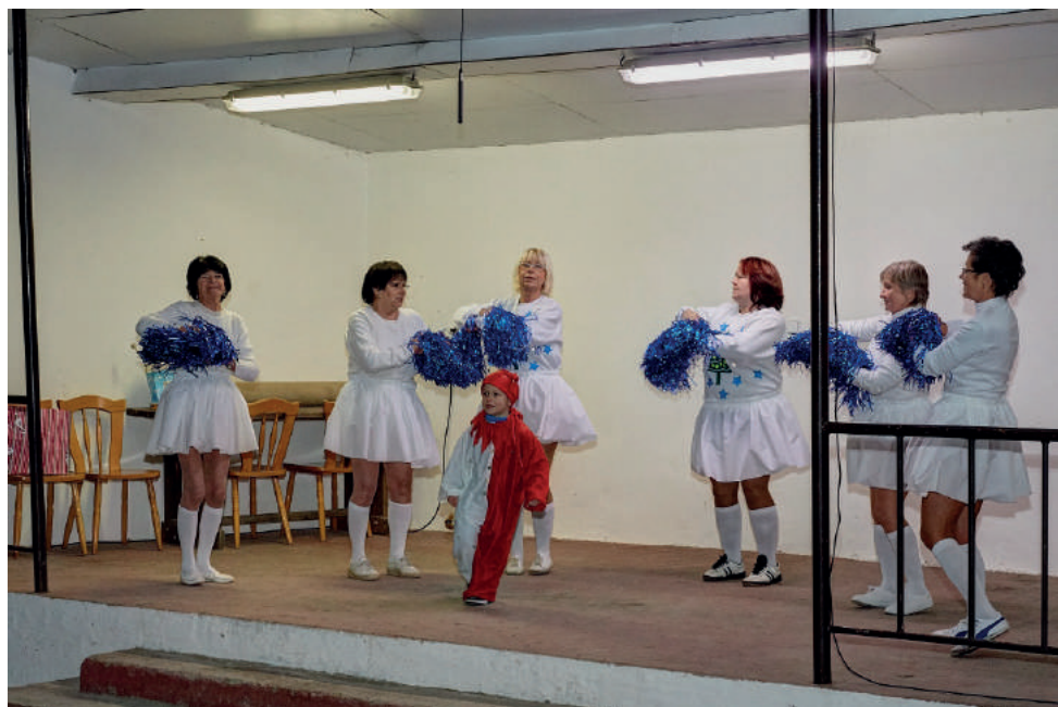
Vystoupení členek SŽMB na rozsvěcování vánočního stromu.