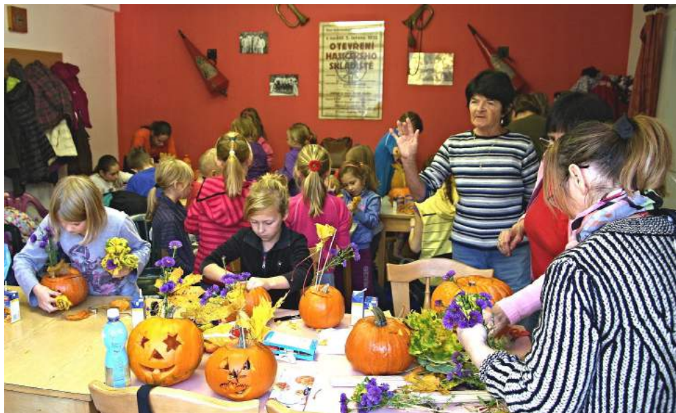
Momentka z Šarovského dýňobraní