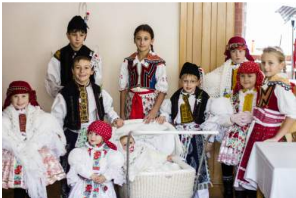
Krojovaná šarovská drobotina