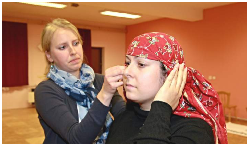
Ty šátky sa samy neuvážú

veselí měla byt Šarovská chasa, sa logicky nabízalo. A tož už zjara objíždajú zástupci chasy archívy na Klečůvce, aby sa z historických záznamů dozvěděli,