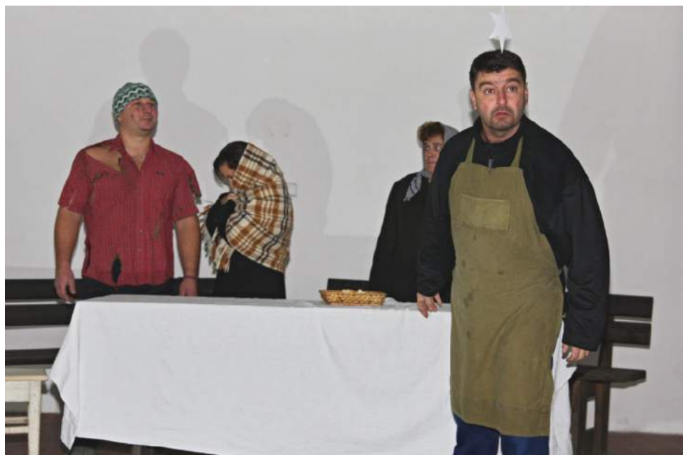
Šarovští ochotníci při rozsvěcování vánočního stromu