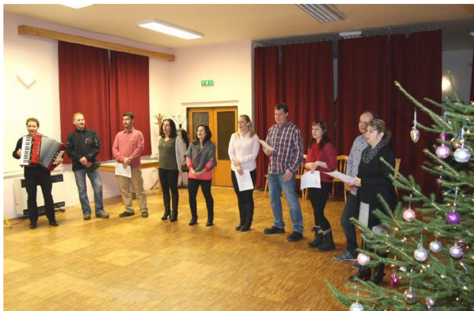
S šarovskými seniory si přišla zazpívat i Šarovská chasa