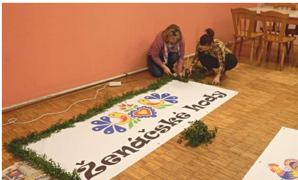
Zdobíme sál

kdy a jak sa správně hody na Šarovách mají odehrávat. A co sa nedalo vyčíst z archívů, moseli nám napovědět ve Slovákém muzeum v Hradišti. A tož