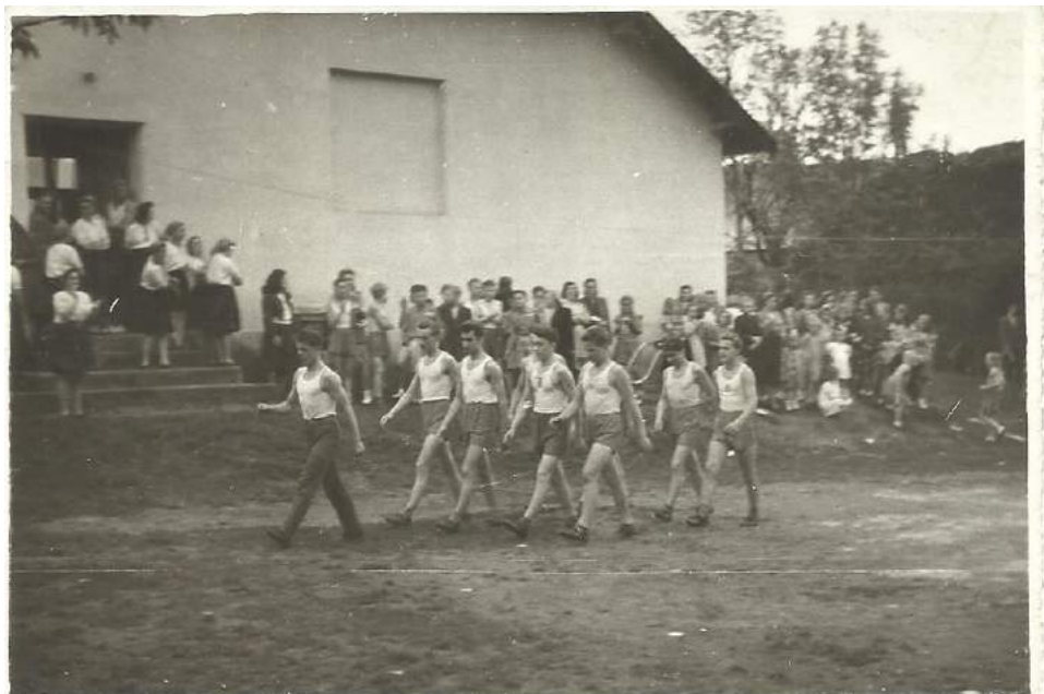
Šarovští dorostenci v roce 1948

Všesokolský slet v roce 1948 v Praze měl možnost zhlédnout jako odměnu za vzorné plnění základní vojenské služby.