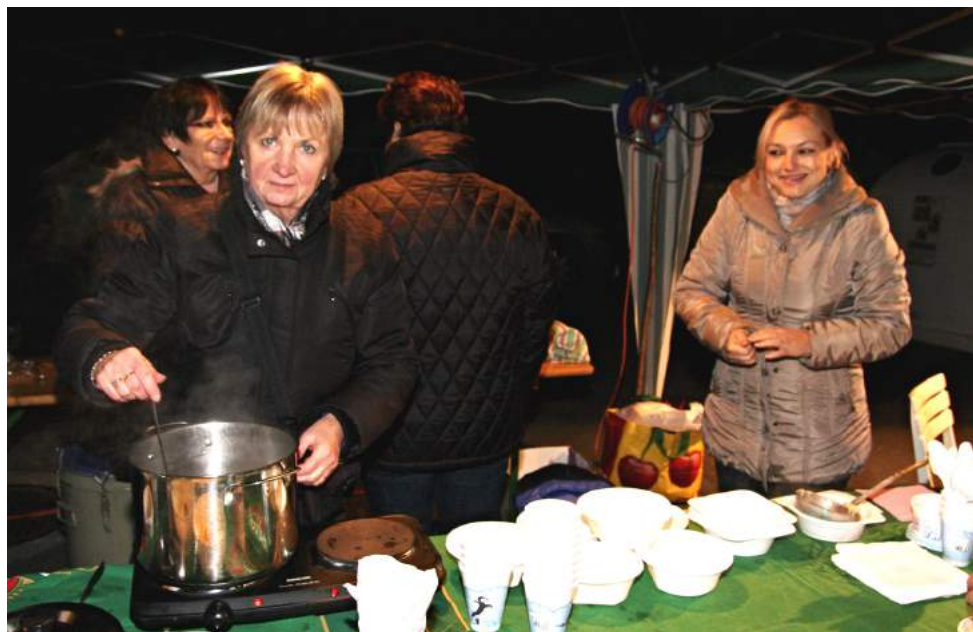
Svařák nebo kyselicu?