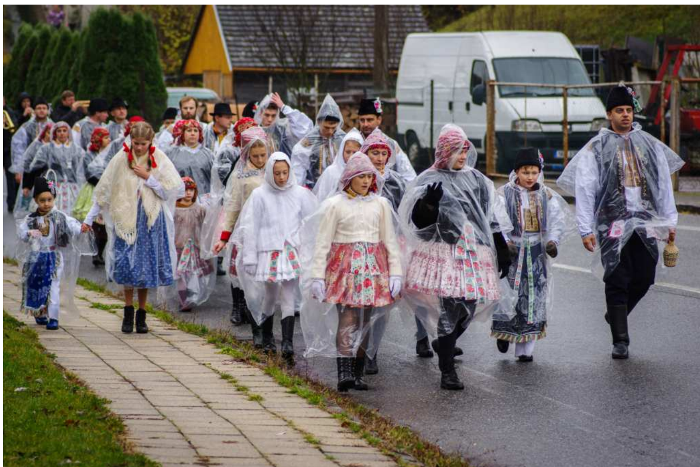
Igelitové hody

Letos sme opět oslovily aj šarovské děcka a divte sa, jedenáct děcek došlo s tým, že chcú jít v kroju a že budú aj tancovat. A od začátku mosím chválit, lebo takto zodpovědné sem nekeré už dlúho neviděl lesti vůbec nekdy. Pravda, každému to občas nekdy ujde, ale většinú naši malí tanečníci makali na každé zkúšce od začátku až do konca, naučili sa nové taneční kroky aj nové písničky a tož postupně z toho bylo osmiminutové pásmo. Lesti jim ten elán, zápal a nadšení