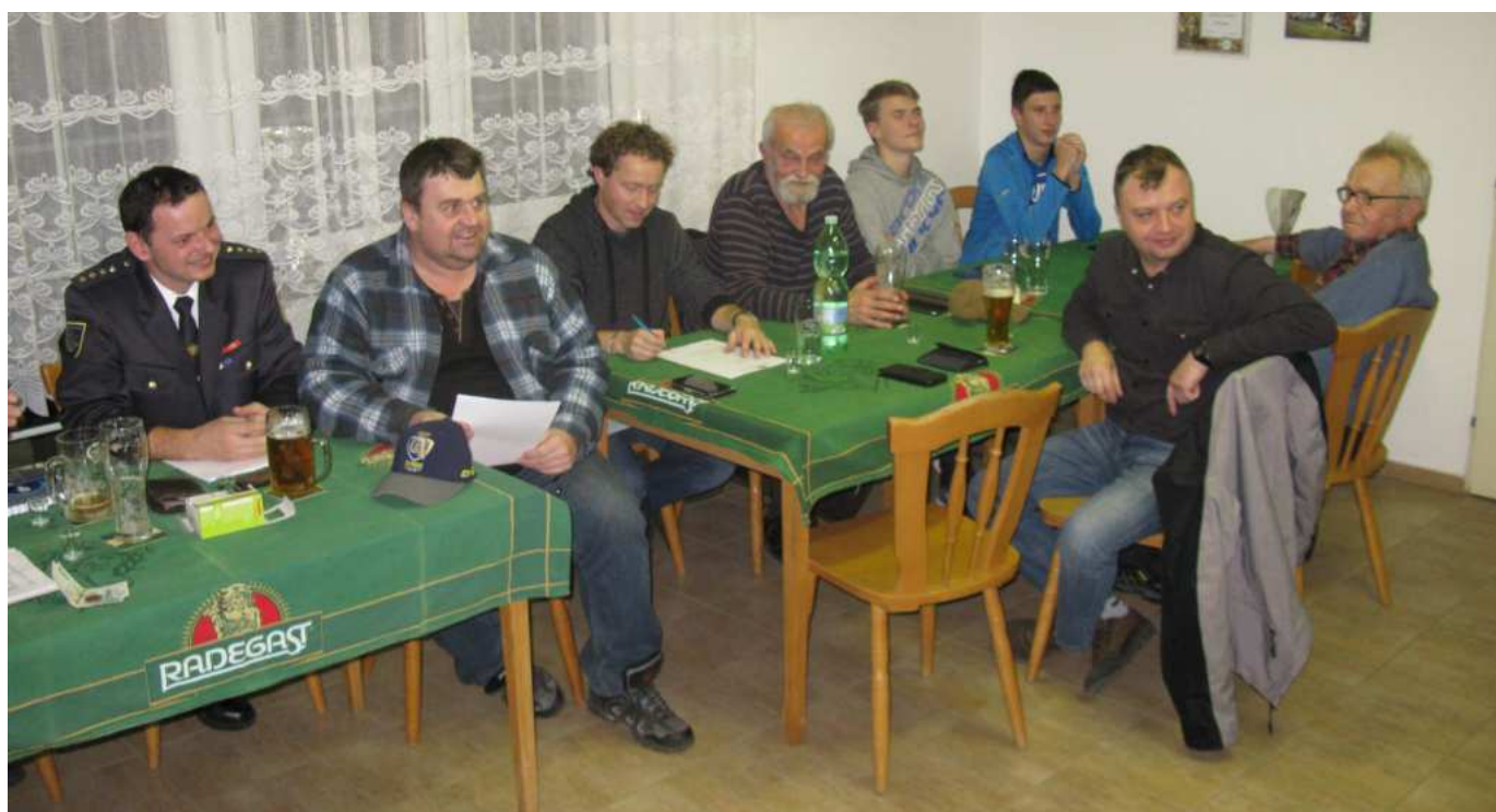
Ze zasedání valné hromady SDH Šarovy

Na valné hromadě vystoupili také zástupci