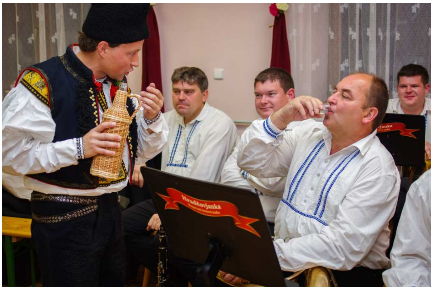
O muziku bylo dobře postarané

Počkáli a hody nám povolili. Potem z úřadu vylézł eště strýc Valenta, kerý naše hody pravidelně podporuje, aj když letos to až zas tak veliká sláva nebyla. Ale dobrých pět litrů. Vína