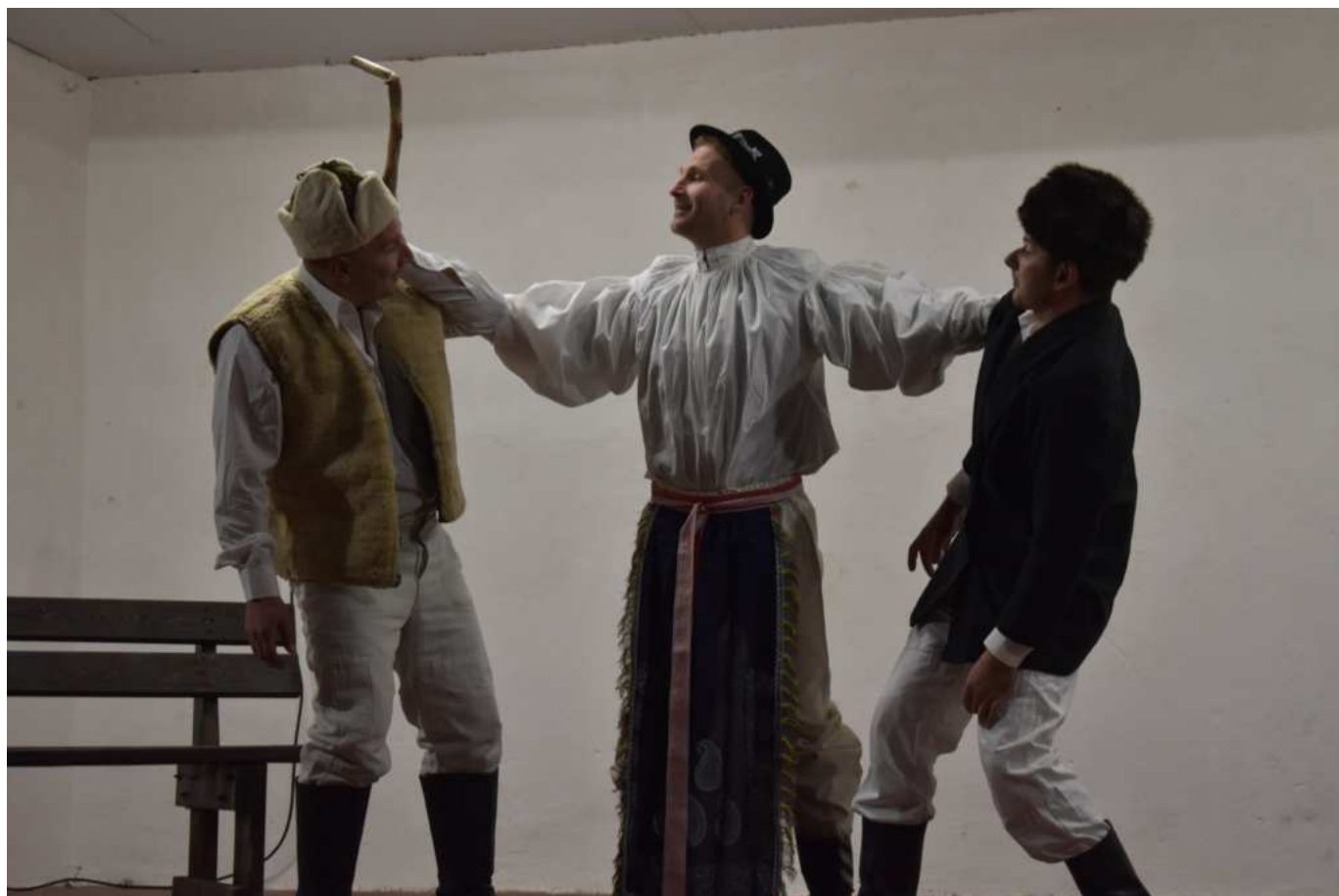
Šarovská taškařice aneb Šarovy sa nesúdí

O příjemnou atmosféru se celé odpoledne a podvečer staralo pěvecké uskupení VOX, které zahrálo nejen moderní vánoční písničky, ale došlo samozřejmě i na klasické koledy. Na malém jarmarku si lidé mohli něco hezkého zakoupit a nechybělo pochopitelně také něco k zakousnutí nebo pro zahřátí, protože i když se teplota držela