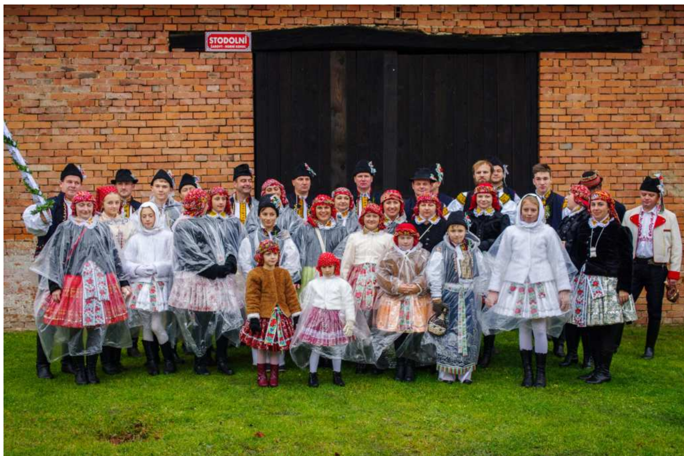
Krojovaní ve vratoch

Šarovská chasa sa proto rozhodla, že napíše ředitelu Dvořákovi do televize dopis, ve kerém ho upozorní, že není dobré, aby sme si vzájemně kradli diváky a tož příští Stardance bude v den konání šarovských hodů zrušené lebo přerušené. O tom eště budeme jednat.