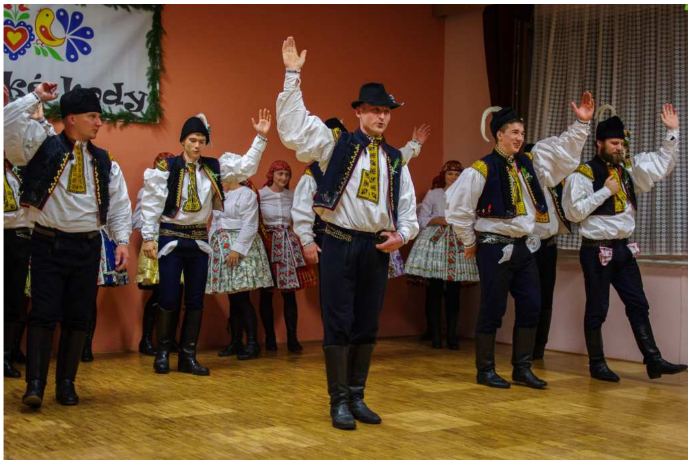
Šohajé malovaní

Teho přemlouvání, vysvětlování a domlouvání na každé zkúške co bylo, to sa spočítat ani nedá. Ono deset párů je dvacet lidí a tož zkus dat dohromady dvacet lidí a nemět přitem tik v oku alebo inší nervovú poruchu. Ono enem domluvit sa na termínu zkúšky bylo občas neřešitelný problém. A zajistit účast všeckých sa rovnalo zázraku. Na druhú stranu, čemu sa možem divit. Když má nekdo v peněženke deset permanentek na fotbal, hokej, házenú, volejbal a všecky cirkusy co jedú kolem, tož potom sladit termín, to je jak vyjednávání o Brekzytu.