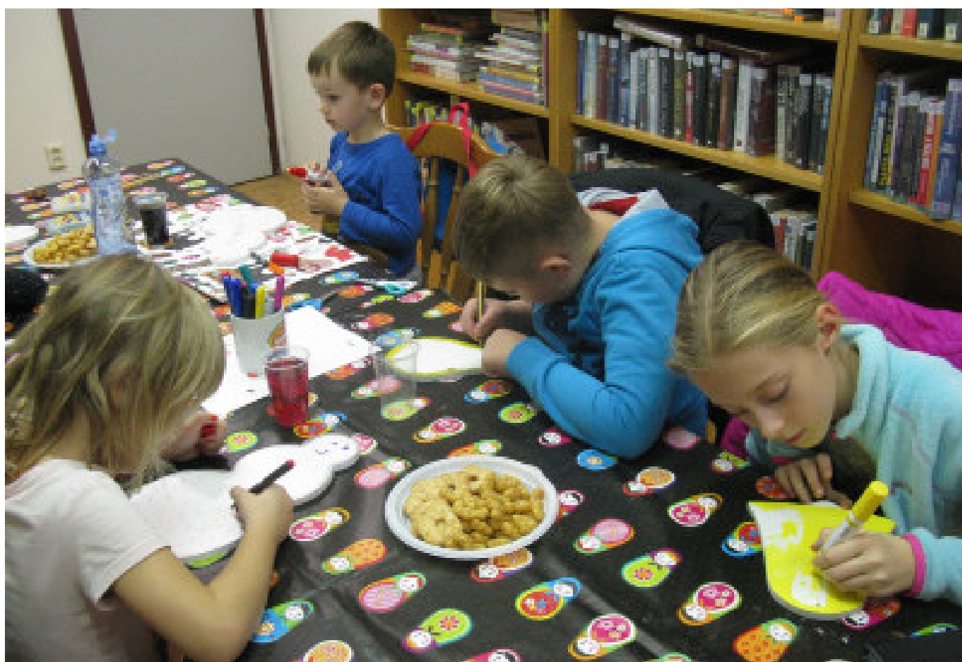
Tvoření vánočních ozdob v knihovně