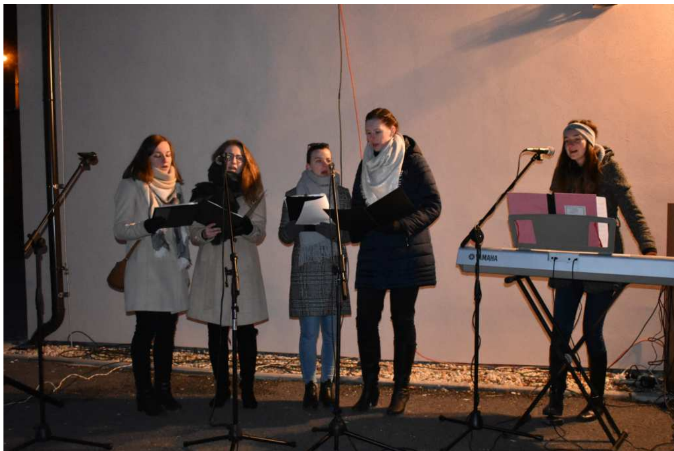
Koledy v profesionálním podání při rozsvěcování šarovského vánočního stromu