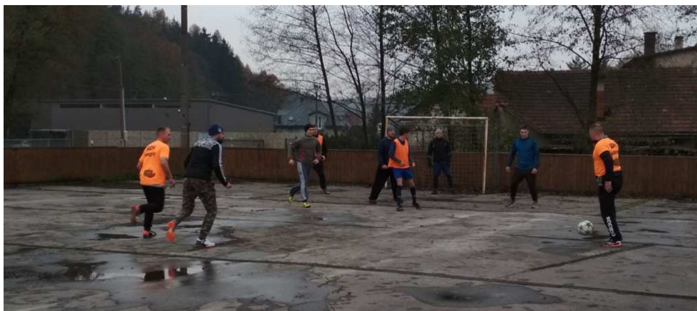
Cesta ženatých k vítězství se nerodila lehce

Svobodní budou mít příležitost opět až za rok, opět po hodové sobotě.