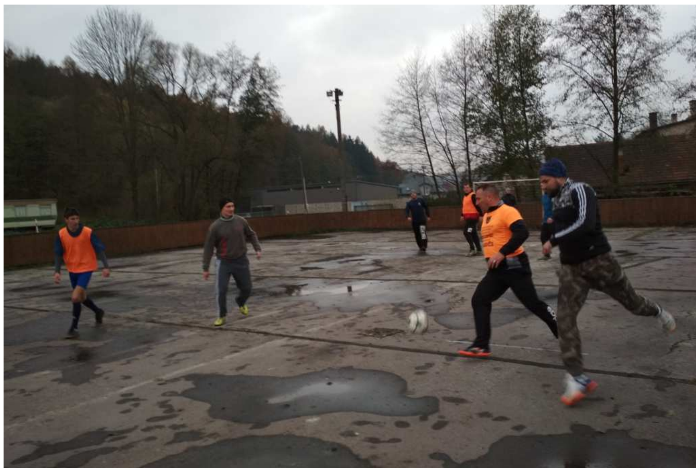
Dramatická podívaná na kluzišti

V minulosti často nebylo jasné, jakým systémem se hodový fotbal bude hrát.