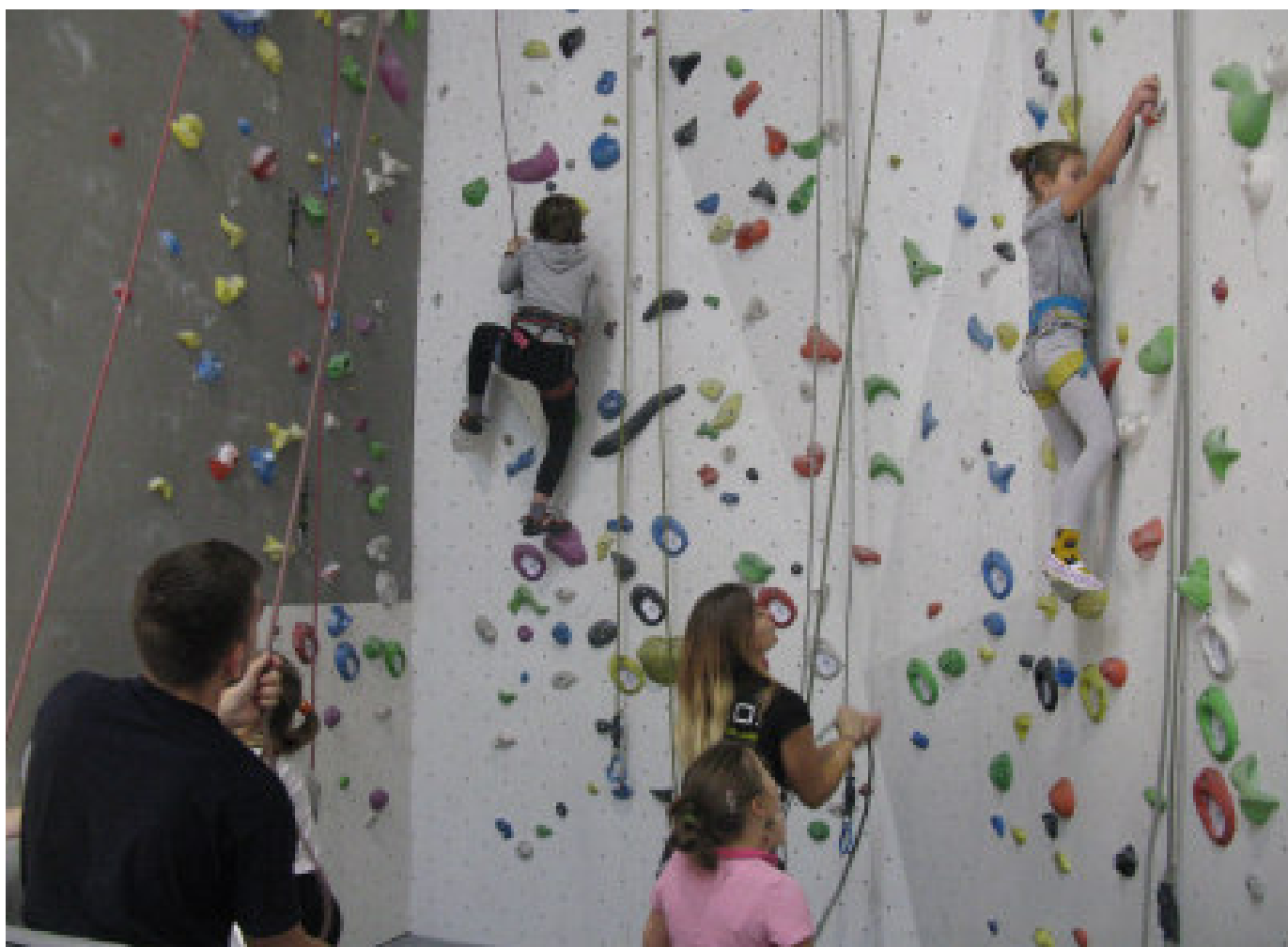
Lezecká průprava mladých šarovských hasičů