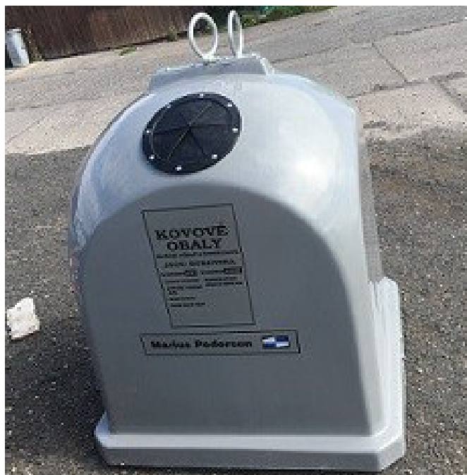
Nádoba na použitý olej (vlevo) a kontejner na kovový odpad - ilustrační foto

plechovky a konzervy a dále ostatní drobné kovové předměty z domácnosti. Prosíme spoluobčany, aby do tohoto kontejneru nevhazovali takový odpad, který sem nepatří, což platí i o kovovém odpadu se zbytky potravin či nebezpečnými látkami (tj. oleje, barvy, ředidla, atd.).